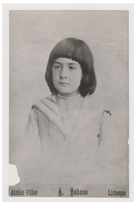
Mário de Sá-Carneiro em criança. Reprodução de um cliché A. Bobone, adquirido recentemente (2016) com a primeira edição de “Céu em fogo”.

Encontrados por nós numa caixa sem qualquer identificação, ainda hoje não sabemos como deram entrada nesta Biblioteca 3 . São poucos (ver adiante), livros de estudo, de literatura infantil e menos infantil, o que condiz com a hipótese de serem parte dos que ficaram em Portugal, quando Mário foi para Paris.