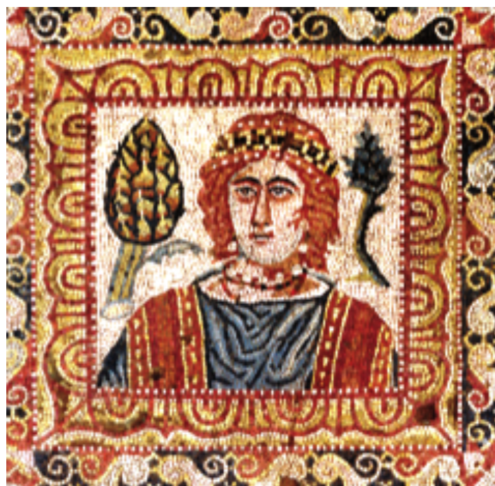
Fig. 3 (em cima) – Inverno, no mosaico da Casa dos Repuxos de Conímbriga. [Pessoa 2005].

Observe-se que, no painel central da Casa dos Repuxos de Conimbriga, o Inverno está representado por «um busto de mulher velada, de expressão triste» (Oleiro, 1992, 117 e 121) – Fig. 3. E no notavelmente bem conservado mosaico das estações da villa romana do Rabaçal, o Inverno é um busto masculino, com «largo diadema de pedras pretas» na cabeça; ao seu lado, um cipreste ou pinheiro; do lado direito, uma alcachofra, que «evoca os xenia com os quais o anfitrião presenteia os convidados» (Pessoa 2008 57) – Fig. 4.