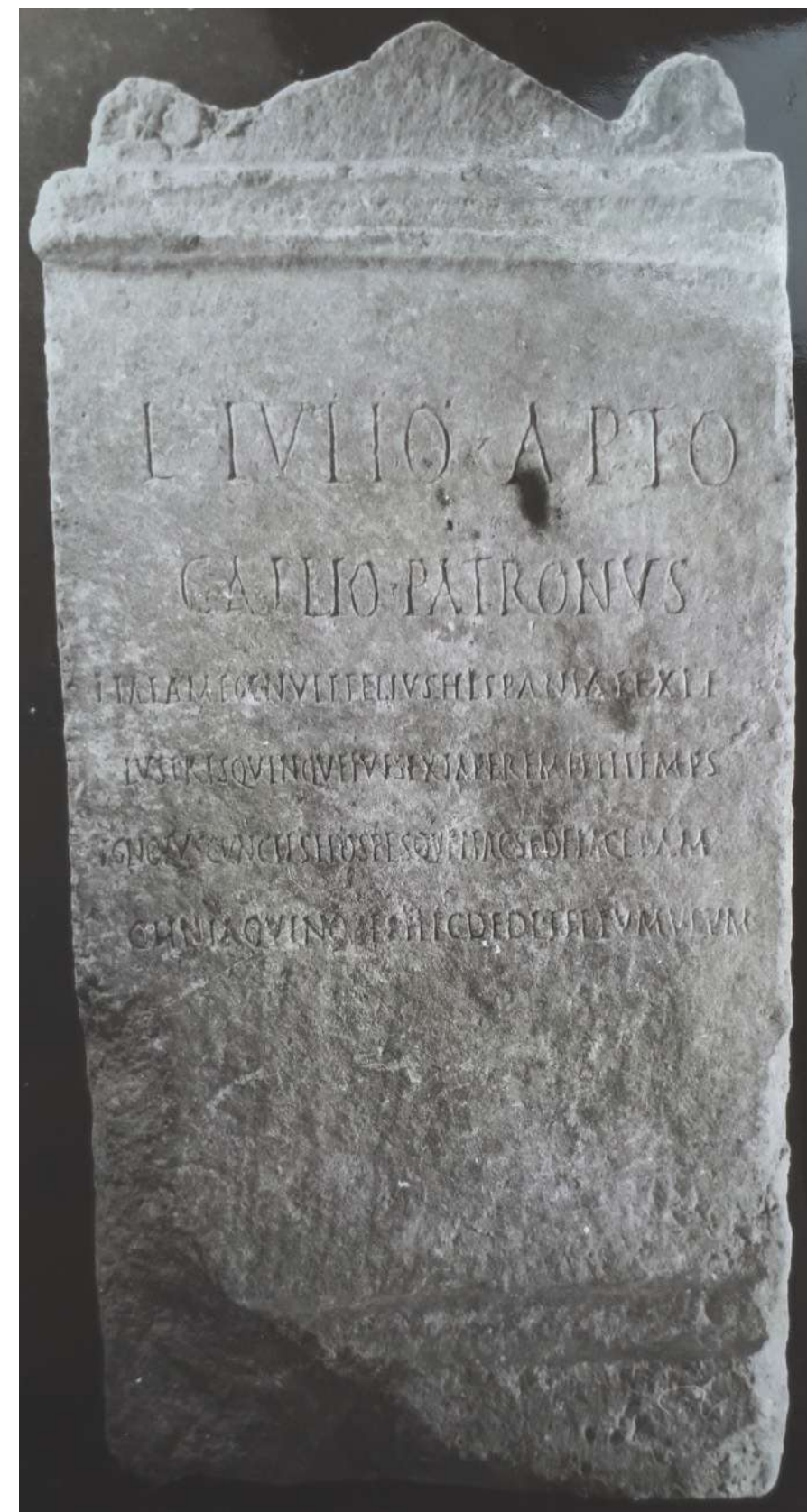
Fig. 1 – Epitáfio de Lúcio Júlio Apto, de Mértola.

Um dado importa, desde já, clarificar, embora saia do âmbito restrito desta nota, que é relativo à tipologia do monumento. Custódio Magueijo classifica-o como «estela», seguindo Lambrino; Leite de Vasconcellos dera a entender, como se viu, que poderia ser um pedestal: «Lápide calcária de forma de ara ou cipo, com frontão e volutas; tem na parte superior um espaço quadrangular de 0,245 m x 0,215 m, para aí pousar uma estatueta ou busto». Trata-se, no entanto, de uma «ara funerária, de mármore cinzento de Trigaches, trabalhada nas quatro faces: moldura do tipo garganta encestada em cima e de garganta reversa na base. [...] O capitel tem dois toros, um de cada lado, decorados com motivos vegetais, ornatos de rosetas de cinco (?) pétalas nos topos [...]» (IRCP 98). O espaço quadrangular, limitado adiante e atrás por dois frontões triangulares, deverá, em meu entender, ter resultado de reutilização posterior. Estamos, pois, dentro da tipologia normal de ara funerária.