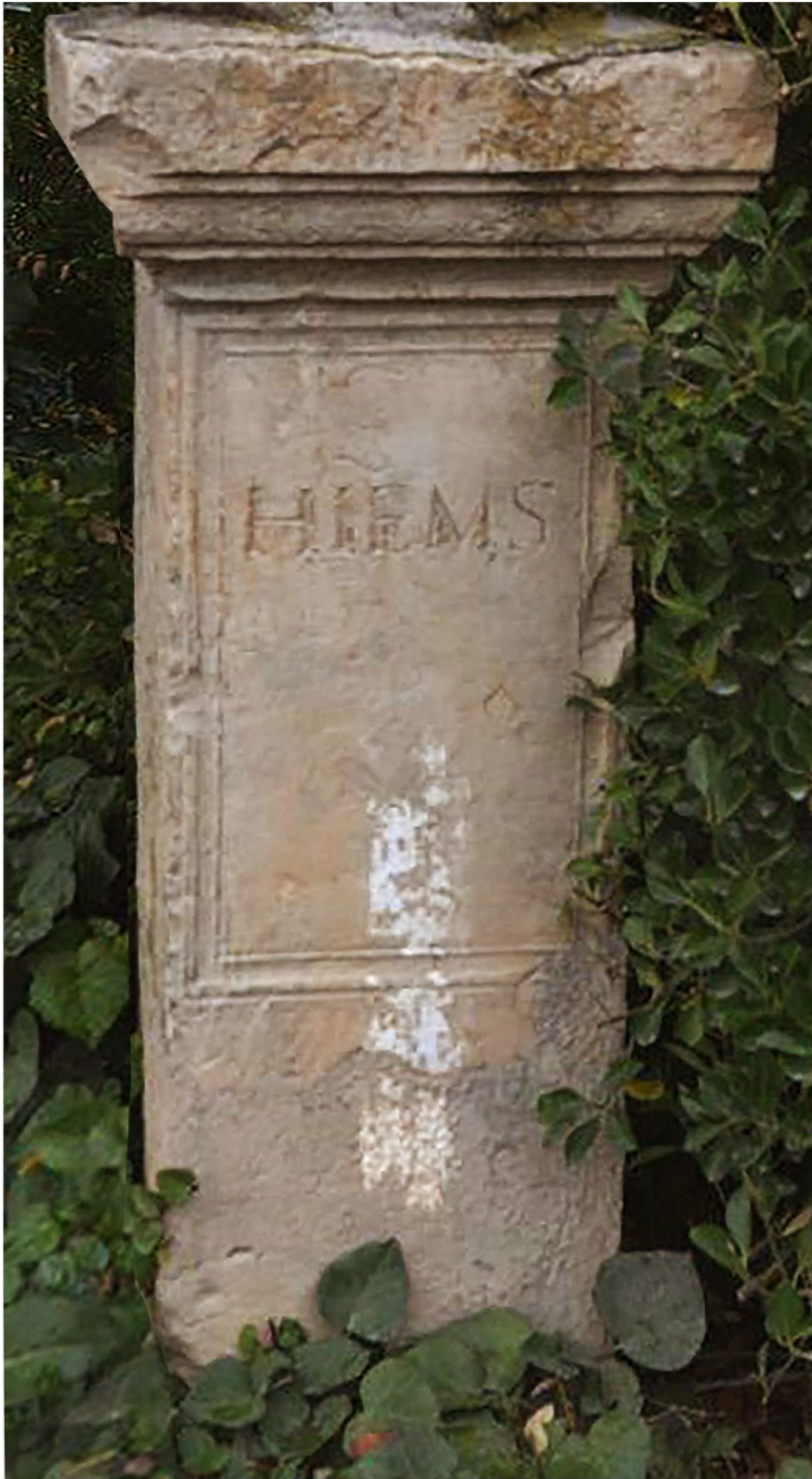
Fig. 5 – O pedestal de Sétif. EDCS, © Jona Lendering, Livius.

Esta última suposição leva-me a aproximá-los dum outro monumento da mesma forma, mas menos alto, que me parece ter a mesma proveniência e que contém este final de inscrição