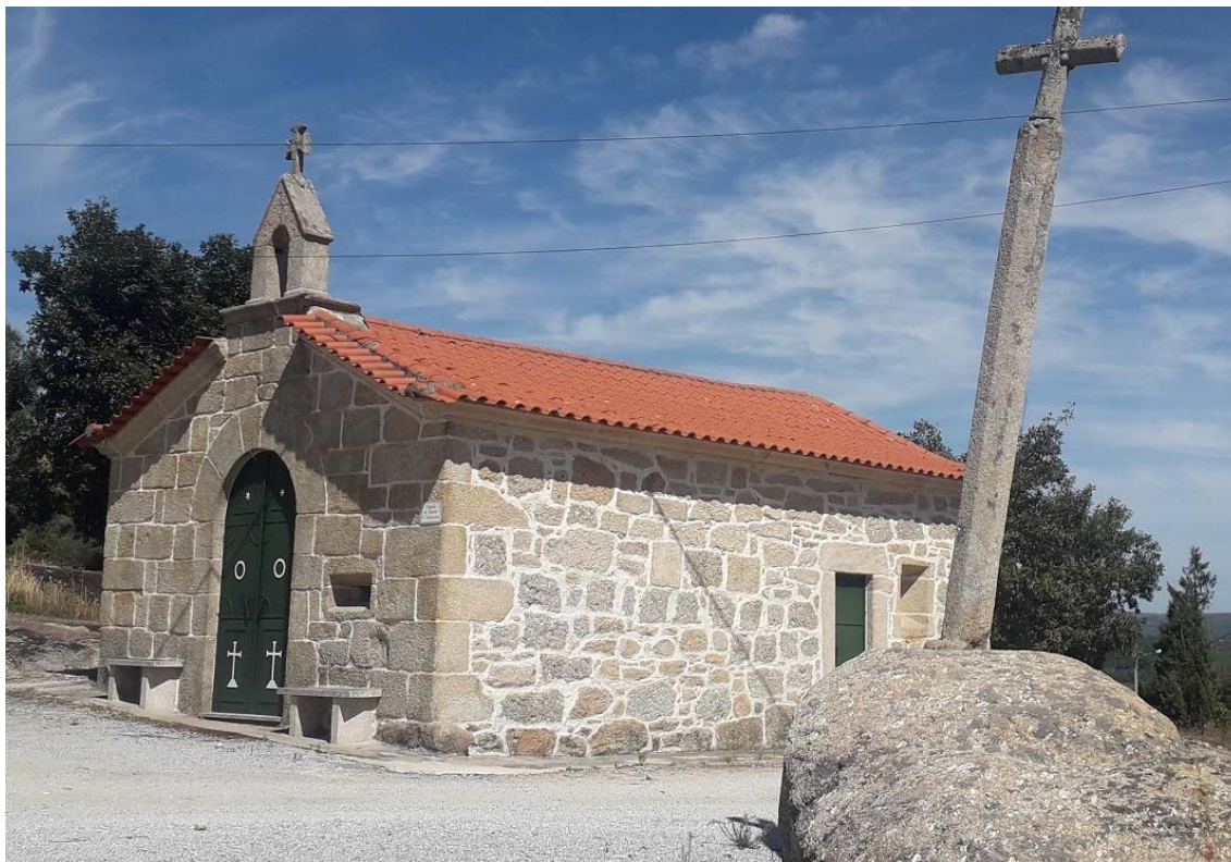
Figura 1 – Capela de S. Sebastião.

Emerge, singela, da paisagem, com seu telhado de duas águas (Figura 1).