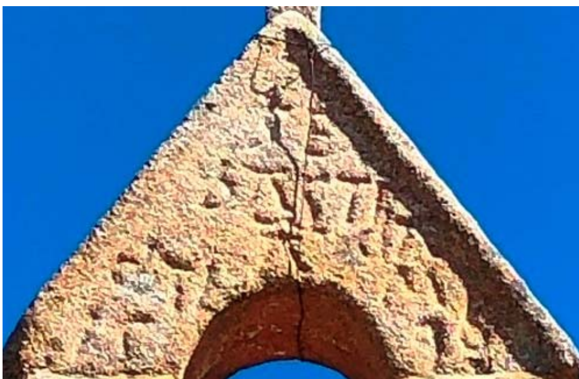
Figura 3 – A inscrição. Fonte: JCSantos

O S está levemente inclinado para diante; o B é minúsculo; o A tem barra superior, assemelhando-se muito ao A uncial que Cordeiro de Sousa apresenta nos seus Apontamentos de Epigrafia Portuguesa (4ª edição, Coimbra, 1983, p. 18); M bem aberto, de vértice inferior quedando-se a meio.