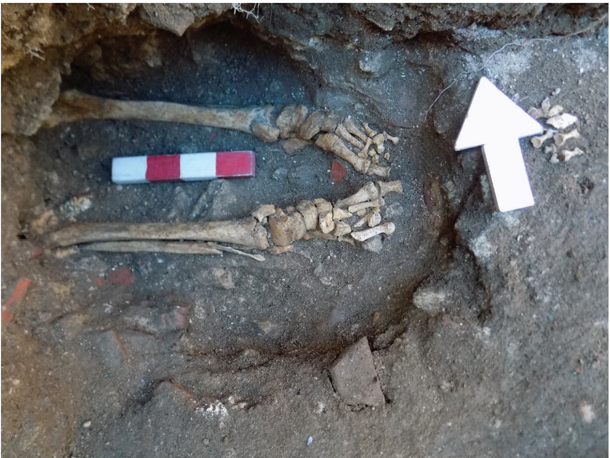
Figura 3 – Sepultura estruturada [Indivíduo 841]. Fase 1.