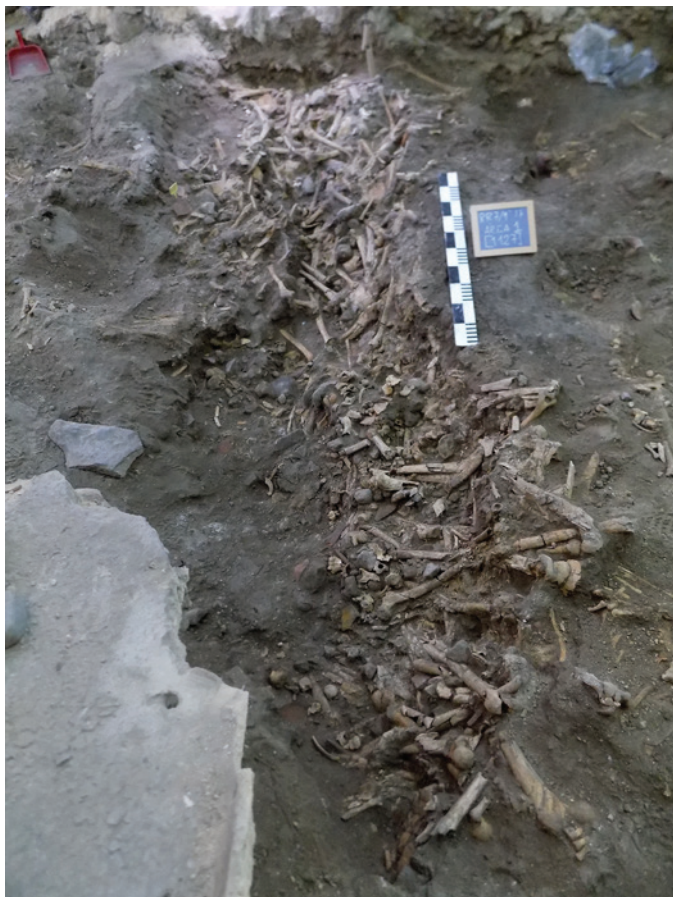
Figura 10 – Ossário 11/Carneiro.