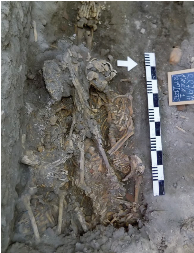
Figura 5 – Sepultura múltipla, vala comum 1 (cinco indivíduos) Fase 3.