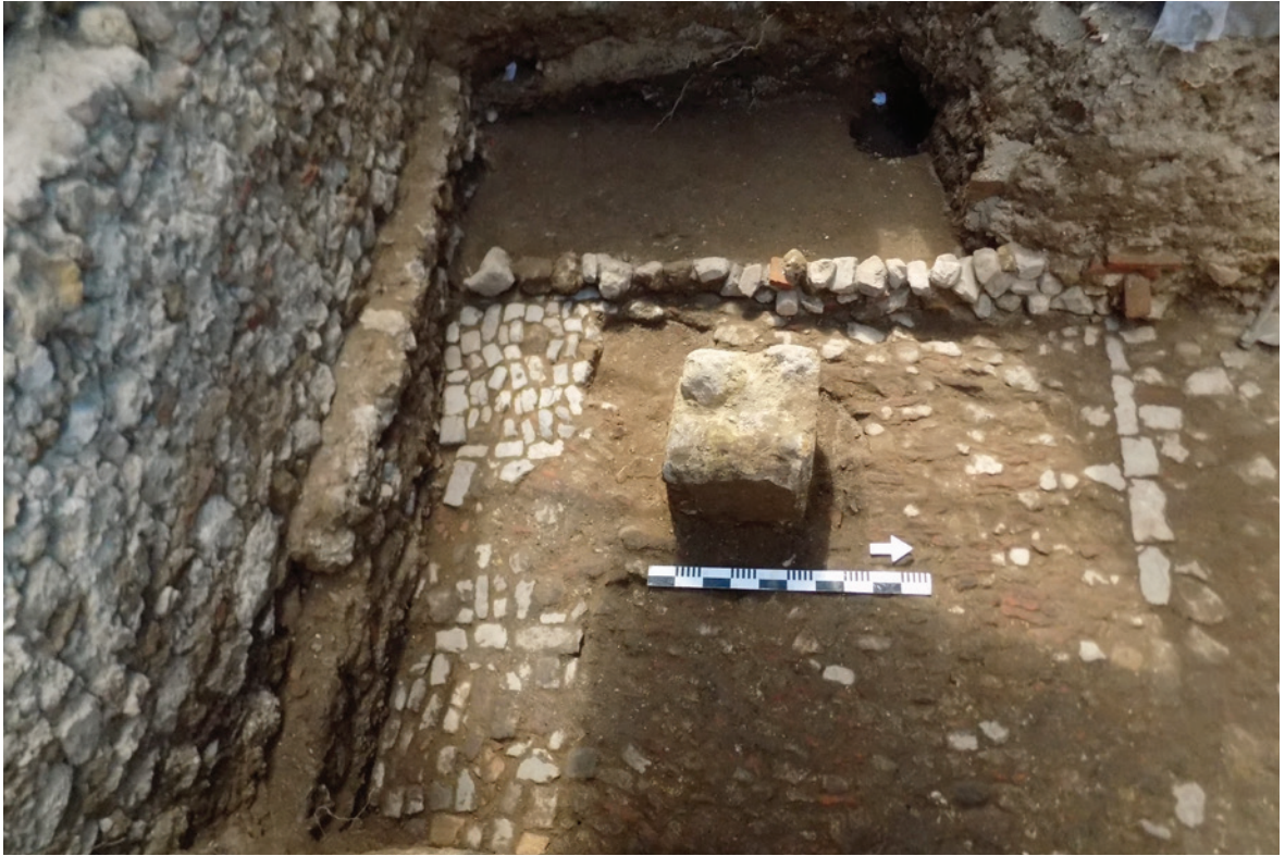
Figura 4 – Plano geral com a localização da sepultura, do piso de terra batida e dos muros que delimitam aquele espaço.