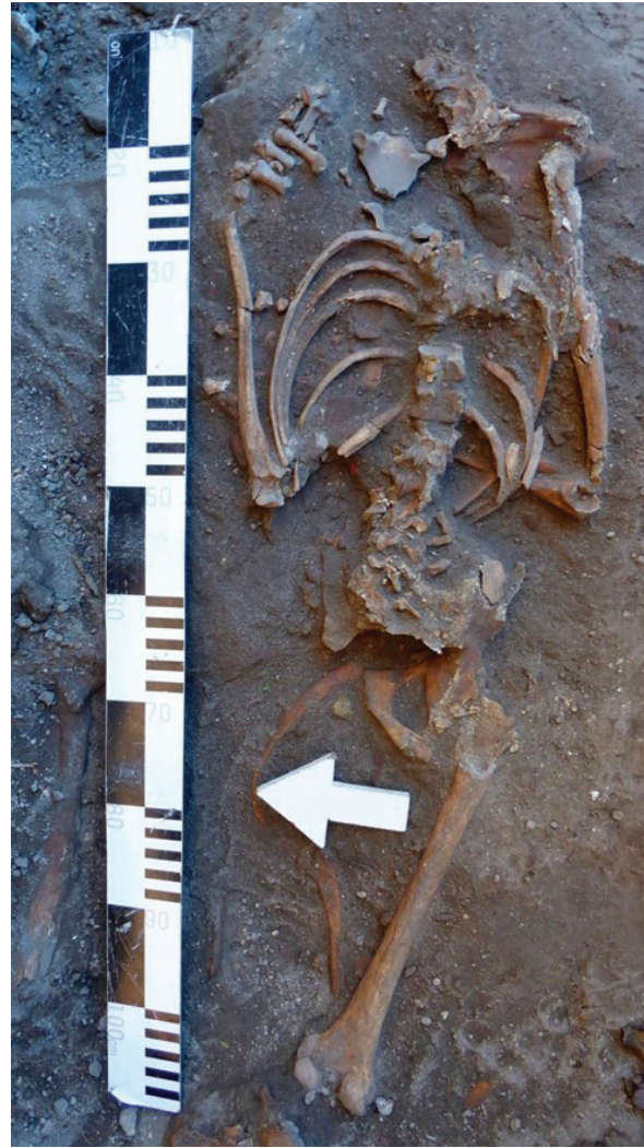
Figura 8 – Enterramento em decúbito ventral [Indivíduo 644]. Fase 5.