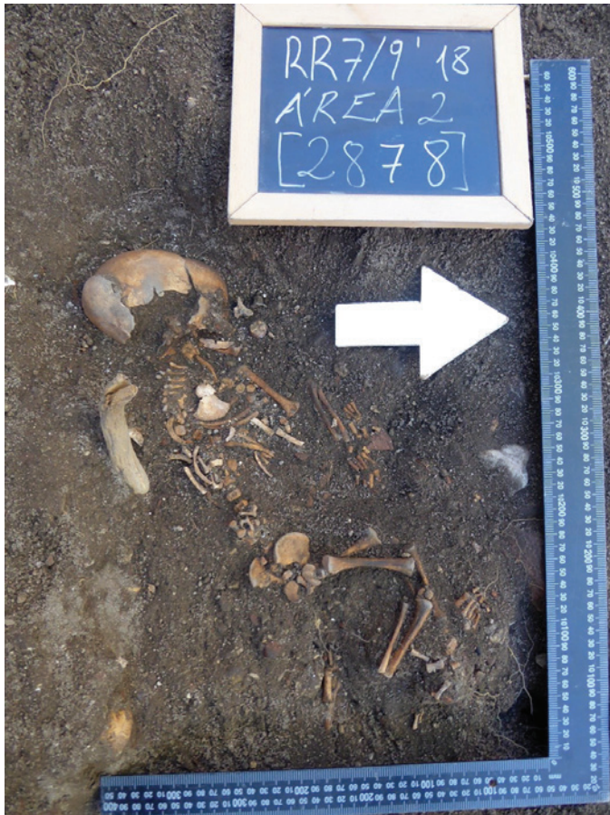
Figura 9 – [Individuo 620]. Fase 6.