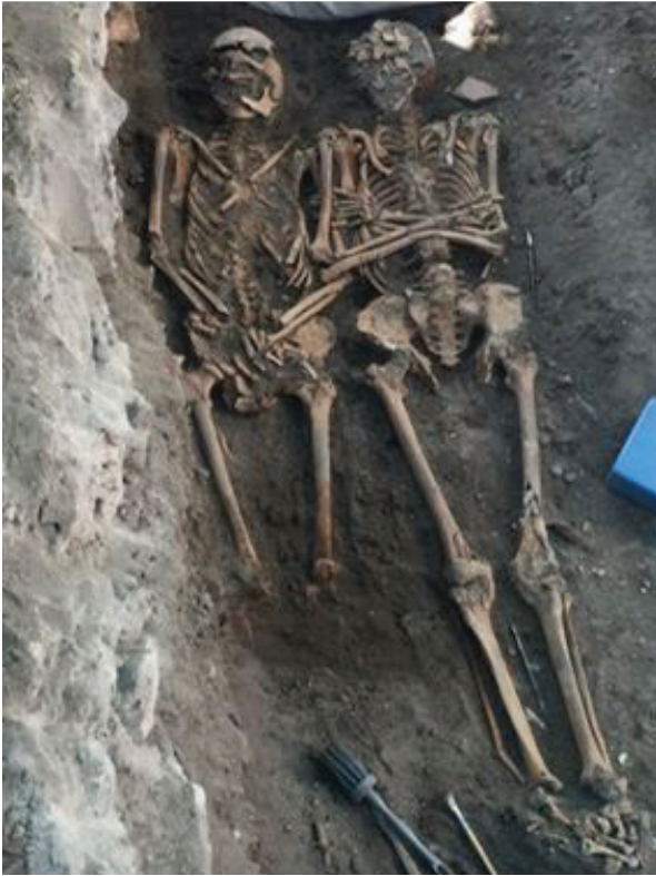
Figura 6 – Enterramento duplo [Indivíduos 18 e 19]. Fase 4.