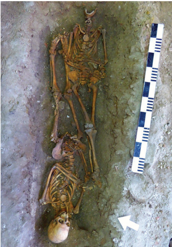
Figura 7 – Sepultura dupla [Indivíduos 335 e 336]. Fase 4.