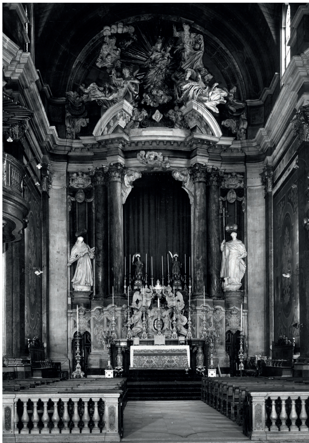
Cappella principale della Chiesa di San Domenico, Lisbona (prima dell'incendio del 1959). João Frederico Ludovice (architetto) e Giovanni Antonio Bellini (scultore), 1748.