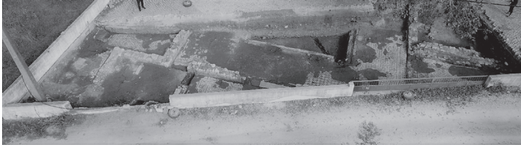
FIG. 1 – Área escavada em 2017 e 2018.