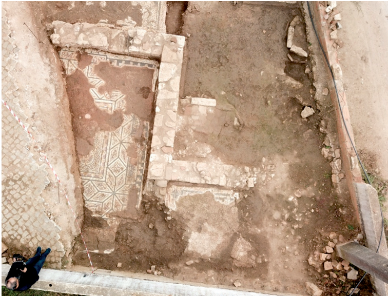
FIG. 2 – Compartimento do mosaico 11.