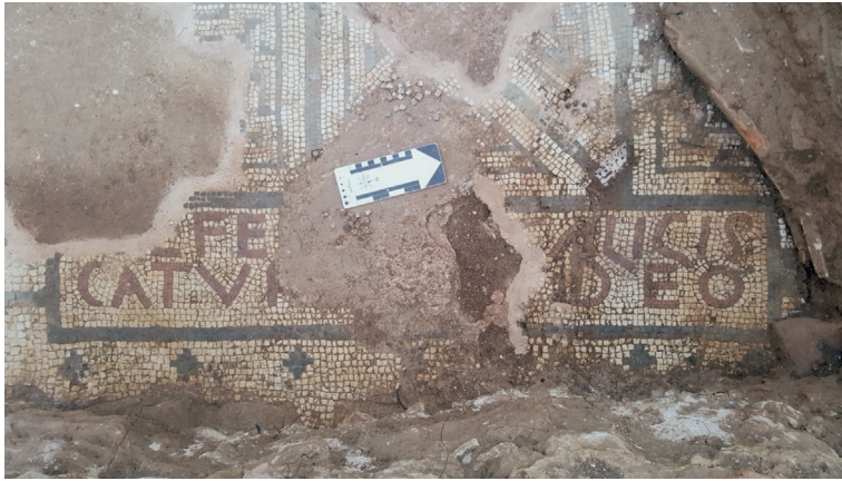
FIG. 3 – Inscrição no Mosaico 11