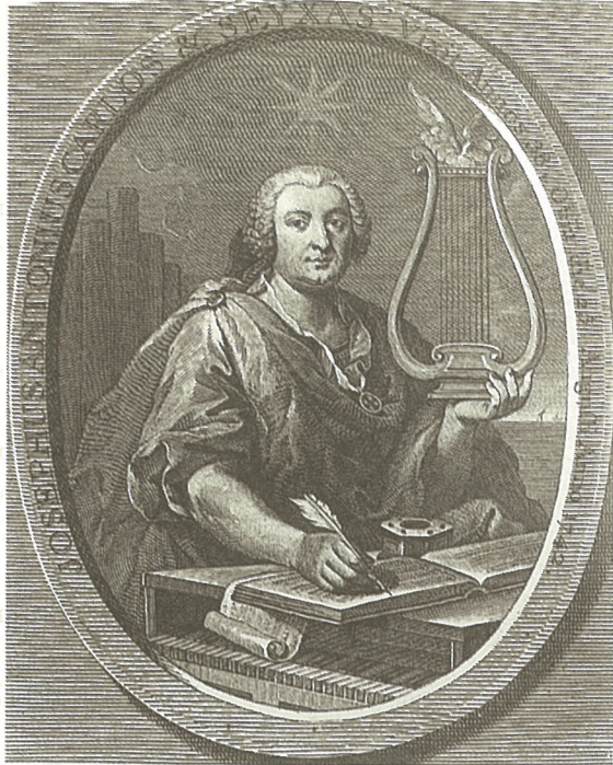
Hanc meriti citharam stelle radiantibus ardi : Divina novitas moribus illi fuit