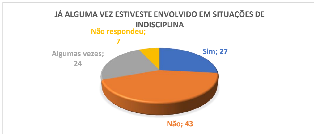
Gráfico 1- Envolvimento em situações de indisciplina

No que diz respeito aos comportamentos de indisciplina, podemos observar que 7 alunos optaram por não responder a esta questão, e contabilizando apenas as percentagens válidas, 54,2% da amostra já esteve envolvida em situações de indisciplina.