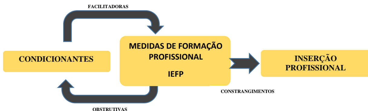
Figura 1 - Modelo de Análise

Afonso (2015, p. 30) menciona no seu estudo, que os programas de formação são instrumentos que “ visam estimular uma cidadania mais ativa ” e permitem melhorar os níveis de inclusão social e de empregabilidade. Contudo, verificou-se no presente estudo que os participantes das diferentes modalidades de formação, nem sempre partilham dos mesmos objetivos e motivações. Importou assim, perceber o que motivava os adultos a frequentar as diferentes Medidas de Formação Profissional.