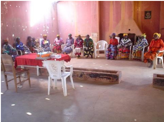
Fig. 4 – Formação de matronas ou parteiras tradicionais, dada pela diretora distrital de saúde e com o envolvimento da CDCS.

Uma forma de aplicar uma abordagem cultural que valorize o conhecimento local é através da colaboração com os praticantes de medicina tradicional (curandeiros e parteiras tradicionais), assumindo-os à partida como tradutores culturais e mediadores entre os dois mundos e aproveitando todas as potencialidades que daí possam advir. Numa avaliação nacional para a UNESCO sobre o Uganda, Sengendo e Sekatawa (1999: 4, 37) referem a importância desta colaboração: “Os curandeiros prestam um espectro alargado de serviços que incluem educação, aconselhamento e tratamento de infeções oportunistas. Eles são respeitados nas comunidades onde trabalham e bastante conhecedores dos assuntos de saúde.”