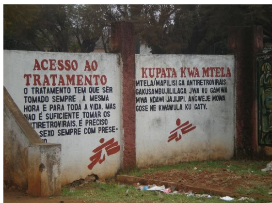
Fig. 5 – Mensagem de rua em português e numa língua local sobre o tratamento antirretroviral

Um terceiro nível de dilemas culturais vividos pelas ONGD em geral e especificamente pelas organizações da área da saúde tem a ver com a língua, a linguagem e o discurso do desenvolvimento.