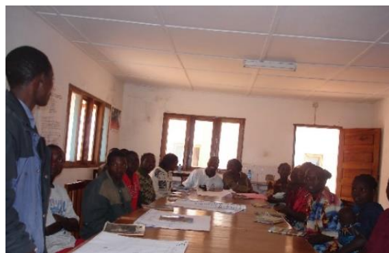
Fig. 2 – Formação de ativistas no distrito de Muembe.