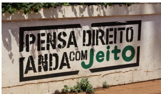
Fig. 1 – Apelo ao uso de (uma marca de) preservativo

Um exemplo deste primeiro dilema são as perceções ligadas ao uso do preservativo. Em conversa com um formador da ONGD 1, também ele moçambicano e originário da província do Niassa, durante uma formação com líderes comunitários (líderes políticos, líderes religiosos e curandeiros), foi referido o seguinte sobre estes líderes com quem a organização trabalha: