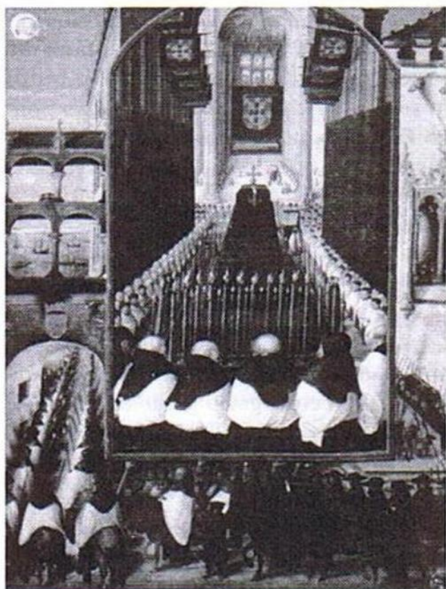
Fig. 1 – Fólio 129v do Livro de Horas dito de D. Manuel (MNAA)