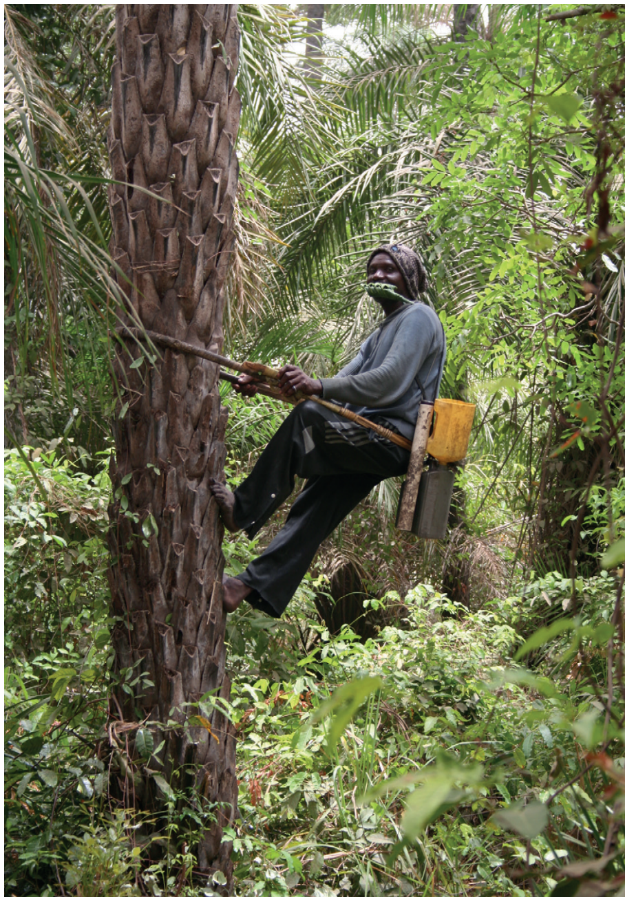
Figura 5: Recoletor de vinho de palma, no Senegal