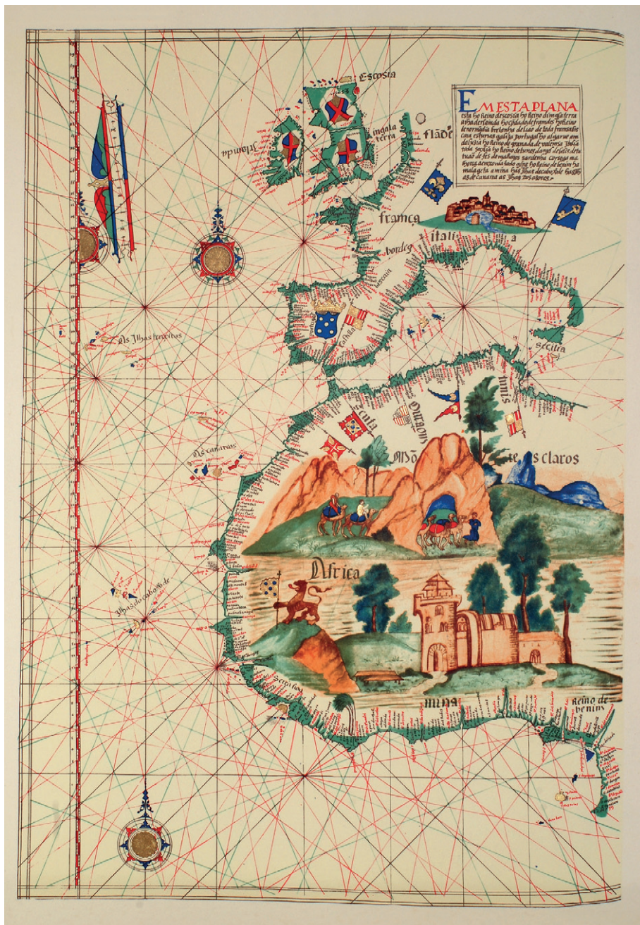
Figura 1: Carta náutica do cartógrafo Português Lázaro Luís, 1563