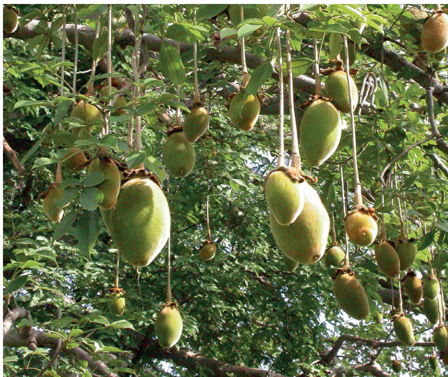
Figura 3: Frutos do baobá africano ( Adansonia digitata ), nos arredores de Pic de Nahouri, Burkina Faso

acharam árvores muito grossas de estranha sorte, entre as quais havia uma que era no pé [em] derredor 108 palmos. E esta árvore não tem o pé muito alto mas como de noqueira; e da sua entrecasca fazem mui[to] bom fiado para cordoalha e arde também como linho. O seu fruto é como cabaças, cujas pevides são como avelãs, o qual fruto comem verde e as pevides secam-nas; do que têm grande quantidade (creio que seja para sua governança depois que o verde falece) 26 .