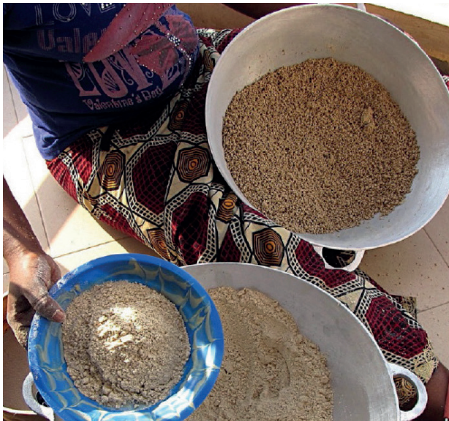
Figura 4: Cuscuz artesanal feito à base de milhete, no Senegal

painço 46 , papas provavelmente feitas farinha de milhete 47 e manteiga, pão da mesma farinha e uma bebida alcoólica que será referida numerosas vezes pelos viajantes, o vinho de palma, assim denominado pela semelhança com o processo de fermentação do vinho de uva, referente máximo de bebida alcoólica para a Europa do Sul 48 .