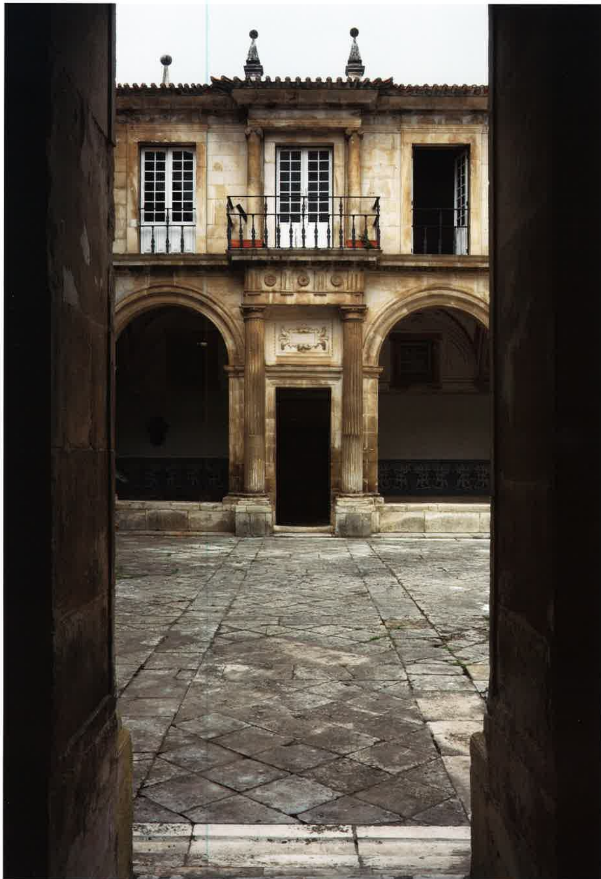
8 Colégio de Santo Agostinho, pormenor do claustro.

a vertente torralviana do claustro também não pode constituir a (...) marca que mais credibilidade dá à intervenção de Tércio (...) 27 , pela simples razão de que se o arquitecto esteve directamente ligado à continuidade das obras em Tomar, também o esteve em São Vicente de Fora, com estratégias construtivas bem