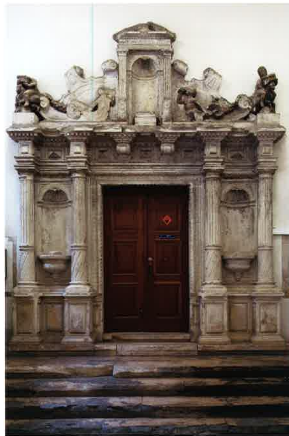
7 Colégio de Santo Agostinho, portal da capela da portaria.