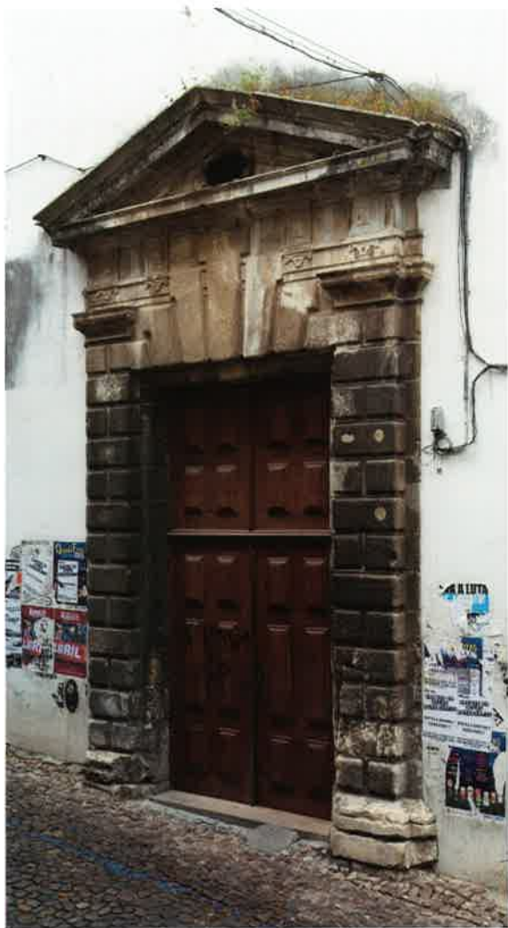
6 Colégio de Santo Agostinho, portal da portaria.

a ala poente do claustro maior 24 . A disposição dos diversos espaços do colégio não é, portanto, portadora de sentidos novos a obrigar a outros percursos, pese embora o facto da igreja aparecer “encerrada” no interior do edifício.