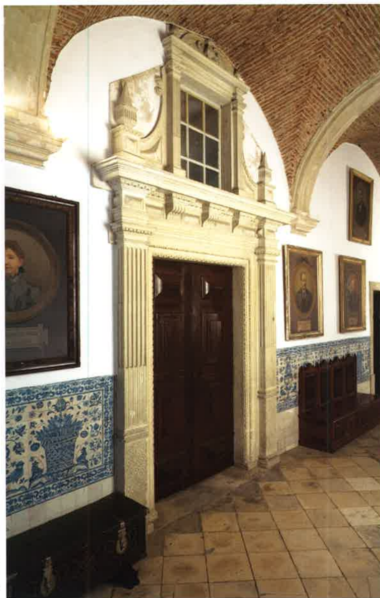
3 Colégio de Santo Agostinho, portal da igreja.