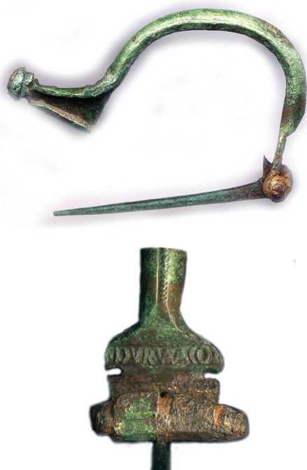
Fig. 7 – Fíbula de Aucissa com marca Durnacus .

peninsulares. Banha da Silva ter-se-á baseado certamente em estudos de cerâmica e essa é uma primeira conclusão a tirar desde já: importa que, doravante, também a onomástica patente nos achados cerâmicos seja contemplada nos estudos onomásticos. Claro, se se der por certa a proveniência africana ou gálica de determinado oleiro, o seu nome não poderá ser tido em consideração para efeitos de estudos demográficos baseados na antroponímia hispânica; mas deverão ser incluídos, obviamente, nos estudos referentes a essas províncias.