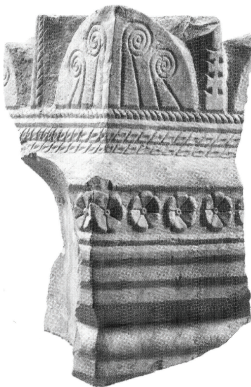
Fig. 2 – Capitel de ara, com decoração vegetalista.