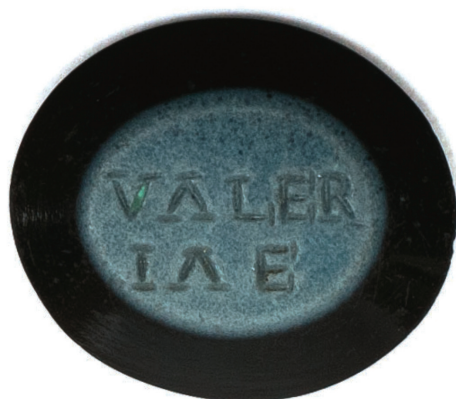
Fig. 4 – Pedra de anel de Tongobriga com a inscrição VALERIAE.

Já no texto de 2006 assinalámos a existência de uma elegante estela da vizinha cidade romana de Ammaia em memória de G. Sentius Capito ( HEpOL , n.º de registo 23 452). Ora, também em Mérida, esse gentílico se regista, por sinal numa das epígrafes mais curiosas da cidade, porquanto ostenta em baixo-relevo uma... taberneira! É o marido, Sentius Victor , que manda lavrar o monumento uxori carissimae, Sentia Ama-