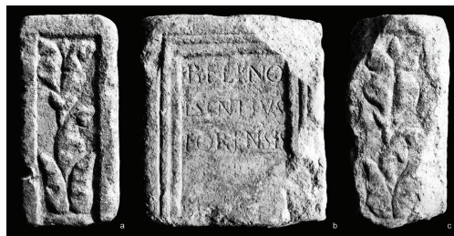
Fig. 5 – Pedestal dedicado a Belenus por L. Sentius Forensis .

Que conclusões se poderão tirar, por conseguinte, de uma pesquisa deste género: que os membros desta família se espalharam por todo o Império? Que pertenceram a um escol, uma vez que encontramos alguns a exercer altos cargos nas magistraturas municipais, e não só, ou atendendo a que significativa percentagem dos testemunhos se referem a libertos? A resposta é negativa a todas essas questões, por serem gerais; podem, no entanto, pôr-se localmente e, no caso donde partimos, a epígrafe de Abelterium , o testemunho da vizinha Ammaia e os testemunhos de Emerita não enjeitam — antes pelo contrário! — a possibilidade de terem existido laços de parentesco entre os indivíduos documentados, dada a proximidade geográfica e o relacionamento fácil que se terá gerado entre estas três cidades.