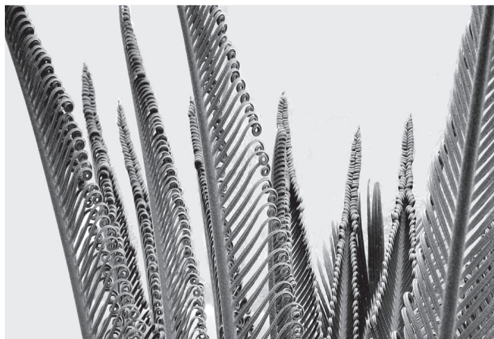
Fig. 3 – Folhas novas de palmeira ( Cycas revoluta ). Foto do autor com arranjo gráfico de José Luís Madeira.

Seja-me, porém, permitido ousar de novo, porque o feto carece de humidade e a palmeira ajusta-se muito mais ao clima mediterrânico, tanto do Algarve como no norte de África. Ora, como a imagem documenta (Fig. 3), não poderia haver semelhança maior entre o que se vê no capitel e as folhas jovens de uma palmeira, a cycas revoluta , conhecida como cica ou sagu do jardim. «Das mais de 90 espécies que integram o género Cycas , só a C. revoluta , de origem japonesa, é vulgar em Portugal, talvez por ser a que melhor se adapta a climas temperados (a maioria das outras são de