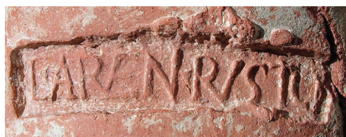
Fig. 6 – Marca anfórica do oleiro L. Arvenius Rusticus .