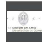
College of Arts of the University of