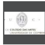
Colégio das Artes da Universidade