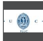
Faculdade de Letras da