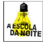
Escola da Noite / Teatro da