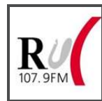
RUC - Radio Universidade de

Este livro de Actas foi elaborado no âmbito do projecto de investigação “ALICE – Espelhos Estranhos, Lições Imprevistas: Definindo para a Europa um novo modo de partilhar as experiências do Mundo”, coordenado por Boaventura de Sousa Santos (alice.ces.uc.pt), no Centro de Estudos Sociais da Universidade de Coimbra – Portugal. O projecto é financiado pelo Conselho Europeu para a Investigação, 7º Programa Quadro da União Europeia (FP/2007-2013) / ERC Grant Agreement n. [269807].