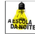
Escola da Noite / Teatro da