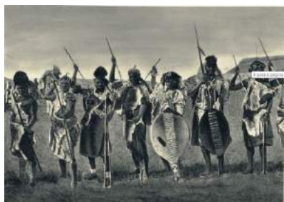
Ilustração 3 Indígenas do Sul de Moçambique. in Rufino, Santos (1929) Álbuns Fotográficos da Colónia de Moçambique

Em termos de povoamento, a região regista na memória local os movimento das populações Tembe nos finais do século XIX, que se deslocavam das zonas de influência Zulu, no sudeste africano. A língua usada pelos seus habitantes resulta duma influência Tsonga e Nguni. Os Nguni são povos guerreiros, criadores de gado, que ocuparam a região sudeste do continente. Por seu turno a língua Tsonga constitui um grupo linguístico complexo que é classificada na família Tswa-Ronga. Em Moçambique, têm diversas variantes. É por vezes conhecida como Changana ou Ronga. A tradição pecuária marca as práticas das comunidades em conjunto com a agricultura de pequenos produtos para consumo. São práticas que exigem territórios de pastagens relativamente extensos, e áreas agricultáveis de proximidade. A defesa das manadas, contra estranhos e contra os animais selvagens marcaram durante o final do século XIX as formas de relacionamento destas comunidades com o espaço.