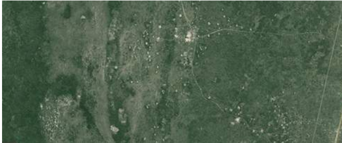
Ilustração 4- Povoamento da aldeia de Djabula, Matutuine. (Imagem Google map)

movimentação de populações contra a sua vontade.