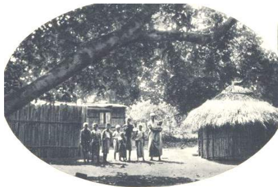
Ilustração 5 - Aldeia do Distrito de Lourenço Marques, in Rufino, Santos (1929). Álbum fotográfico da Colónia de Moçambique.

As primeiras ideias de desenvolver a agricultura para abastecer o mercado em Catembe e daí chegar a Maputo, não resultaram. Rapidamente ficou claro que a agricultura era uma actividade marginal. Tão marginal quanto a área. O tipo de solos e a dificuldade em captar águas foram dois dos principais problemas que emergiram dessa experiência. A principal vocação de Matutuíne era a pecuária e não a agricultura. Uma observação mais atenta e um melhor entrosamento com as populações locais fizeram entender que, fora das margens de aluvião dos rios, não havia condições para a agricultura.