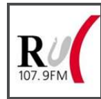
RUC - Radio Universidade de