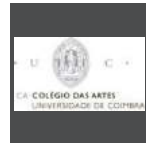
Colégio das Artes da Universidade