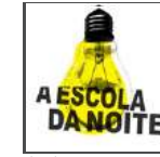
Escola da Noite / Teatro da