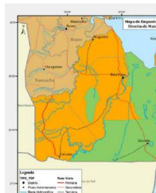
Ilustração 1 Baía de Maputo - Mozambiek