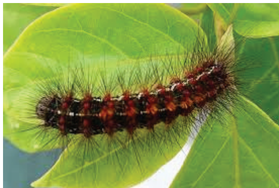
Figura 1: Tatarana ou Taturana

equaciona no tecido do lembrado vertido em discurso: “Quero é armar o ponto dum fato, para depois lhe pedir um conselho.” (GSV, p. 232). Riobaldo quer saber de Riobaldo, quer compreender como pode uma Tatarana, a custa de uma longa metamorfose, converter-se num Urutu Branco.