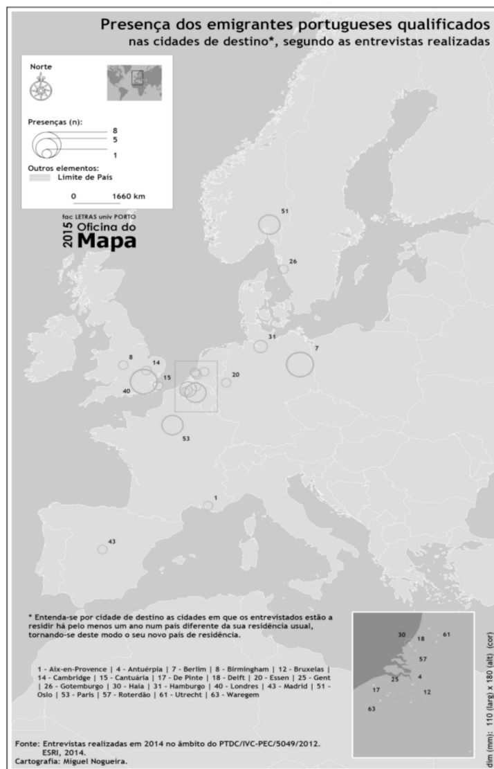
Figura 1 Presença dos emigrantes portugueses qualificados nas cidades de destino,* segundo as entrevistas realizadas

Nota: * Entende-se por cidades de destino as cidades em que os entrevistados estão a residir há pelo menos um ano num país diferente da sua residência usual, tornando-se este consequentemente o seu novo país de residência.