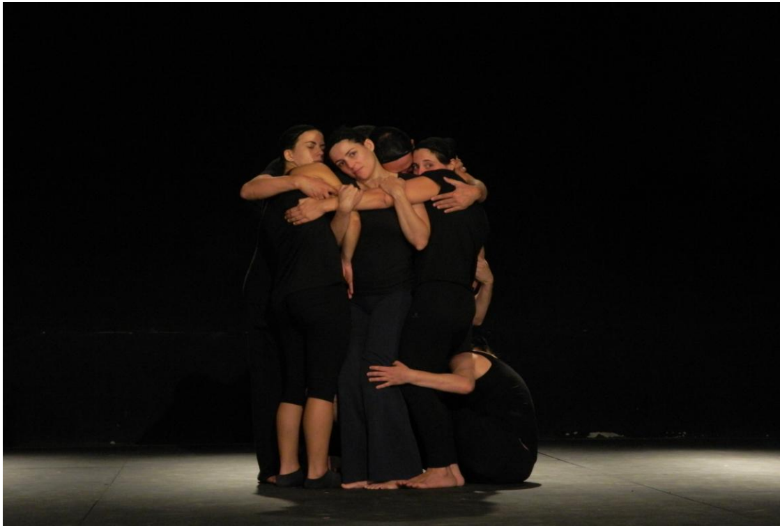
Figura 4. Exercício Coralidade.

Por último cita-se a Coralidade, que soma-se aos planos de expressão do ator e às Graduações e exercita a dissonância, a ruptura e a consonância, em narrativas em coro. Um olhar rápido sobre um coro de pessoas agindo em conjunto já expõe um corpo de muitas cabeças, uma unidade de muitas partes. Agir em coro significa, primeiramente, aceitar as restrições do coletivo, de um grande corpo formado de muitas partes operando de forma interdependente. É aceitar um eu coletivo, um agir no seio da comunidade.