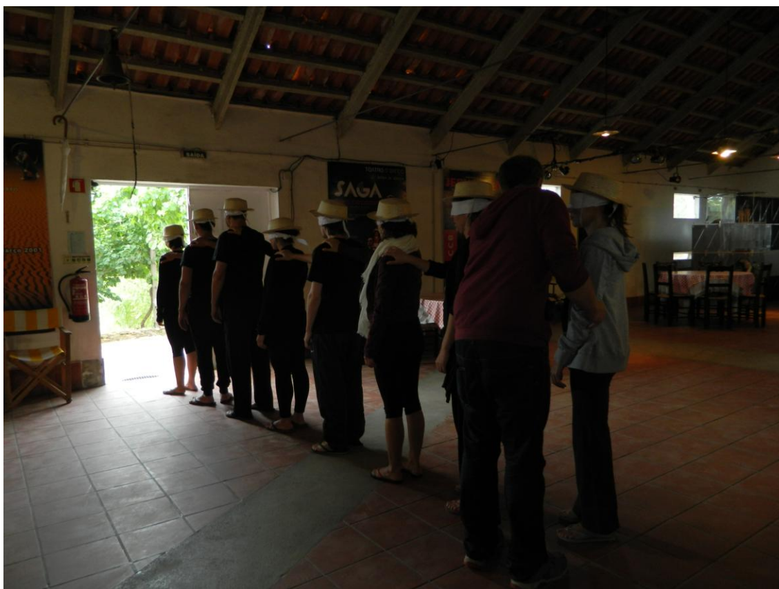
Figura 5. Início exercício Vendados

Consiste o exercício em vendar os olhos dos atores e conduzi-los a diferentes espaços durante algumas horas – sala de estar, palco de trabalho, serra. Essa dinâmica deve ser feita em silêncio, restringindo a interação dos atores ao tempo/espaço presente do exercício, sendo que a relação dos atores com os outros atores não deve ser encorajada nesse momento.