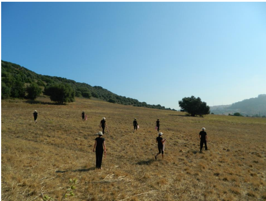
Figura 1. Exercício Sensações Concretas , na quinta de Vale dos Barris/Palmela, sede do Teatro O Bando.