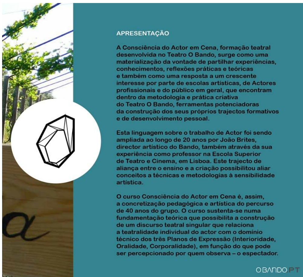
Figura 2. Apresentação do curso

Todos os módulos objetivam instrumentalizar o ator para o domínio em três planos gerais trabalhados em inter-relação constante: