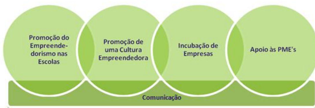
Figura 1: Eixos de Atuação do Projeto Aveiro Empreendedor.

Foi neste âmbito que o Projeto Aveiro Empreendedor foi concebido e elaborado o seu Plano de Ação, com a participação dos vários atores locais relevantes, para a prossecução de três linhas estratégicas definidas para Aveiro. A partir destas foram traçados cinco eixos prioritários [Figura 1] sendo que um deles (Comunicação) é transversal aos restantes.