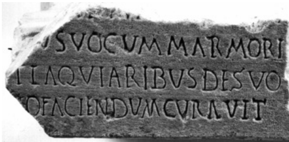
Figura 5. Epígrafe do sarcófago de Soure.

inter et laquearia tres senatores [...] (Tácito, Anais , 4, 69, 1); Non inpendebant celata laquearia sed [...] (Séneca, Cartas a Lucílio , 90, 42); [...] repente lacunaria sonare coeperunt totumque triclinium intremuit (Petrônio, Satíricon , 60, 1-3).