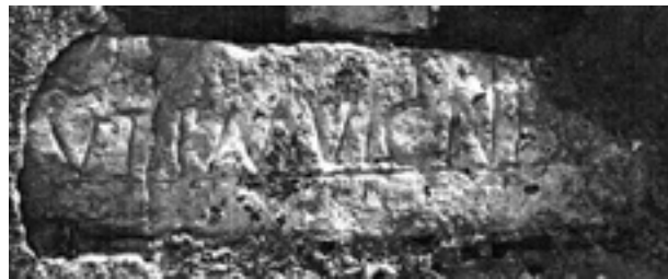
Figura 4. Inscrição romana de teor administrativo, de Santiago da Guarda.

Na villa romana de Santiago da Guarda, riquíssima de mosaicos com bem erudita decoração (TRINDADE et alii 2006), há uma epígrafe que diz: VE(ctigale) R(ei) P(ublicae) M(unicipii) VICINI (fig. 4). Ou seja, este prédio, ainda que situado em território alheio (o de Seilium , actual Tomar), está colectado, para efeitos de impostos ( vectigalia ), no «município vizinho», que seria o de Conimbriga ! Compreende-se como, por detrás deste singelo escrito, rudemente gravado numa pedra de muro sem