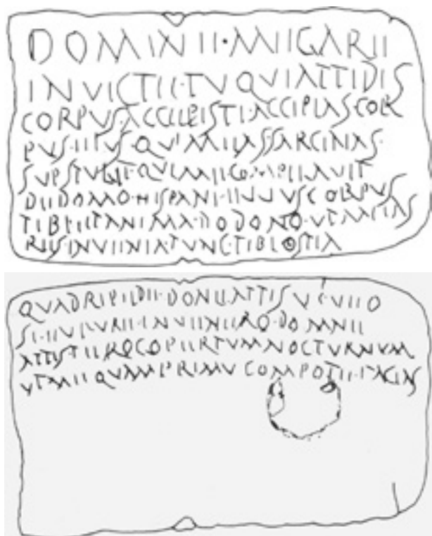
Figura 6 e 7. Faces A e B da tabella defixionis de Salacia.

60 anos, mandada lavar pelo seu liberto e herdeiro, Moehus [?]. Ceplca? Moehus? – cada novidade, cada nova questão!... Esse, o supremo encanto das... novidades epigráficas!.