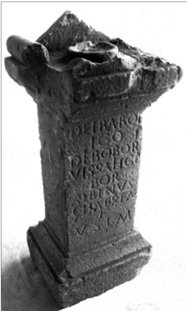
Figura 1. Altar fundacional da Viseu romana.

tro Daire), no Cabeço das Fráguas (Sabugal), em Arroyo de la Luz (Cáceres). A descoberta, em 2008, de mais um documento desse teor na área de Arronches, reactivou a discussão, até porque, a par da menção a divindades já conhecidas doutras epígrafes ( Banda, Cosus, Reva, Cantibidona... ), novos teónimos se registaram ( Broeneia , por exemplo) e foram proporcionados elementos passíveis de fazer considerar a epígrafe como documento do sacrifício sazonal de certo número (dez?) cabeças de gado, em locais tidos por sagrados, situáveis nas