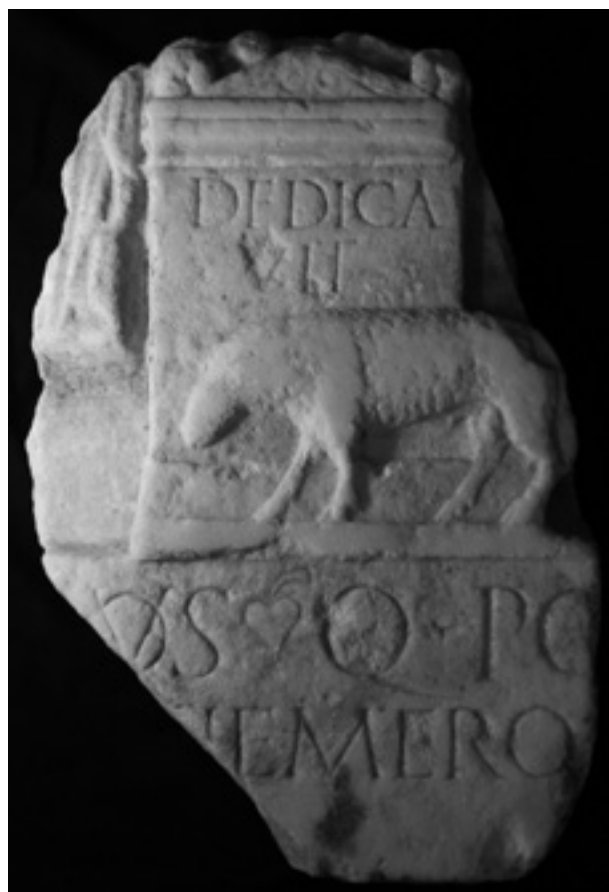
Figura 8. Placa votiva de Salacia.