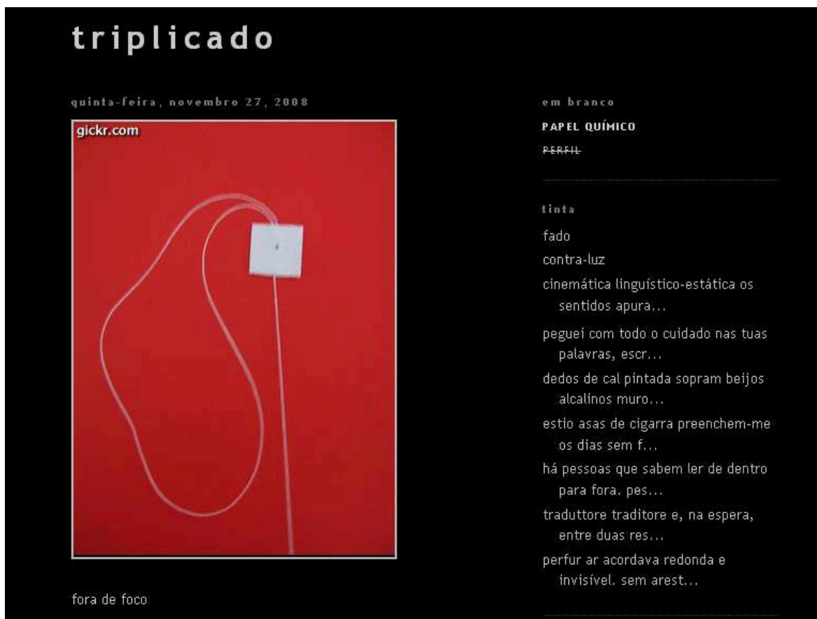
Figura 5. Triplicado , http://triplicado.blogspot.com/2008/11/blog-post.html . Data de publicação: 2006-2011 [captura de ecrã].

trabalhadas por filtros algorítmicos, e que se afastam da imagem que é mera reprodução de imagem pintada ou fotografada. Nestes exemplos acentua-se a hibridez entre literatura digital e arte digital.