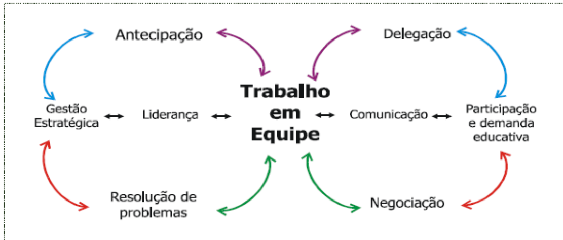
Figura 1: Desafios da Educação. Retirado de Freitas e colaboradores (2003, p. 17)

Perante este clima de mudança, Fullan (2003) afirma que «liderar numa cultura de mudança implica desvelar os mistérios das organizações vivas».