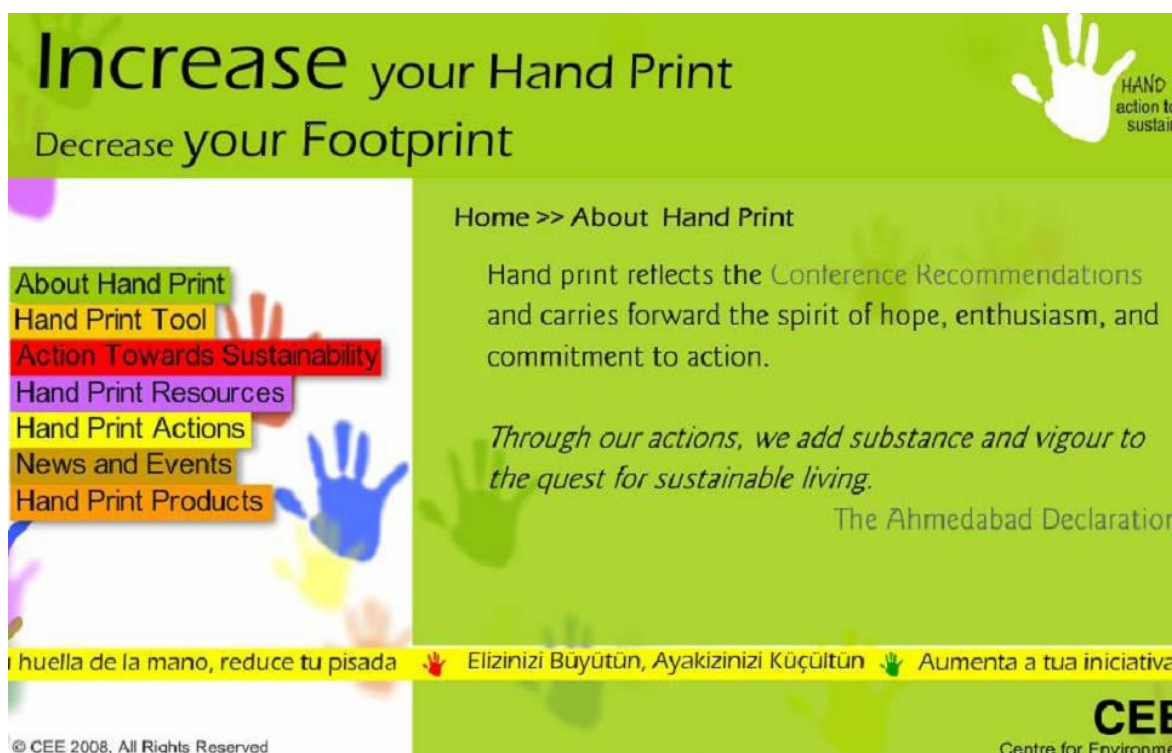
Figura 1.- Parte da página "About Hand Print" extraída de http://www.handsforchange.org/ [Acedido: 02/12/2009].

Por último, no âmbito de recursos apropriados para trabalhar aspectos práticos de sustentabilidade, referem-se os "The Hand print Resource Books" 13 . O conceito "Hand print", que se contrapõe ao de pegada ecológica, foi apresentado na Quarta Conferência Internacional de Educação Ambiental, organizada pela UNESCO, UNEP e Governo da Índia, realizada em Ahmedabad, em 2007, e reflecte recomendações da Conferência, como se ilustra na figura 1.