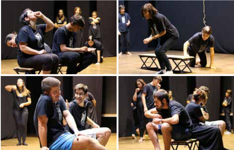
Sequência 3 – Os atores da Oficina de Teatro de Condeixa experimentam cenas improvisadas em um exercício envolvendo o formato “O Banco”, na noite de 14 de setembro de 2018, no Cine-Teatro de Condeixa