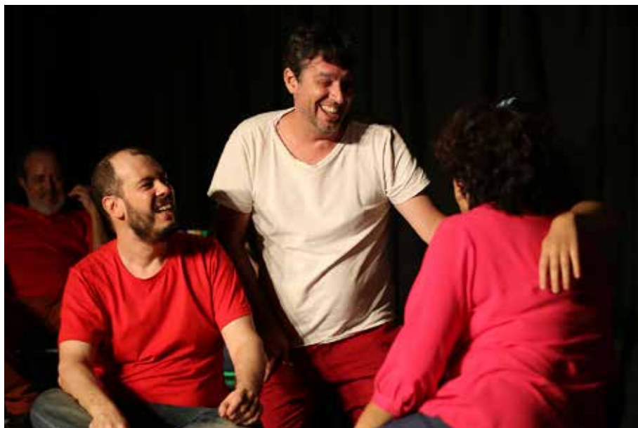
Foto 8 – O Teatro do Nada apresenta seu espetáculo “Rio de Histórias” no Circuito Carioca de Impro, na noite de 7 de abril de 2018

mandam muito mais dos praticantes de long form , os quais, além de atuar como jogadores, roteiristas e diretores, como no short form , agora precisam trabalhar igualmente como editores, cenógrafos e atores completos, capazes de encontrar um caminho de interpretação mais autoral, orgânico e próximo à realidade cotidiana. Tal perspectiva se coaduna com a ideia do processo criativo em performance como defluência do encontro entre o artista, visto como “ performer no sentido amplo do termo – ator, encenador, cenógrafo, iluminador”, e o espectador (FERNANDES, 2011, p. 17).