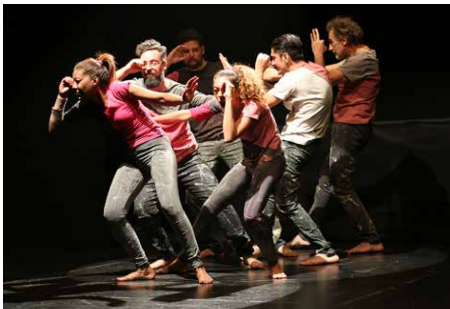
Foto 7 – O coletivo ImproMime apresenta o espetáculo “Solidões Públicas” na oitava edição do Festival Espontâneo, na noite de 31 de março de 2019

a outro quando o corpo do ator começa a produzir ação”. O autor reflete que “quando um ator se arrisca a improvisar, conta com três instrumentos para ajudá-lo a desenvolver a situação: o corpo, a voz e a imaginação” (ÁNGEL, op. cit. , p. 113). Esses três recursos, conjuntamente a um treinamento sistemático, permitem que o ator possa instantaneamente dedicar-se à criação, construindo cenas em um palco vazio, a ser explorado a partir de imagens, sensações e afetos que chegam a seu corpo, de modo a elaborar uma história a partir do convívio com a audiência.