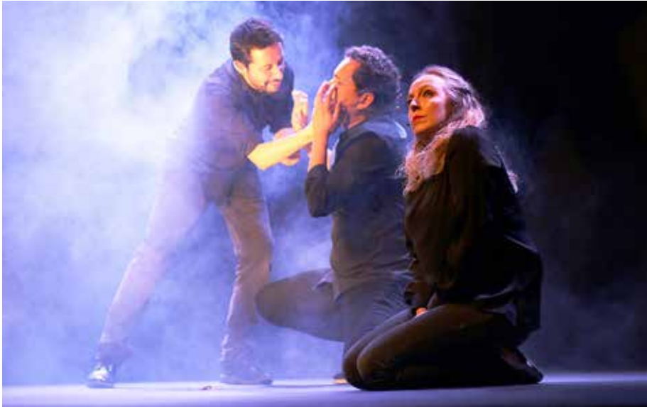
Foto 23 – Os Improváveis apresentam seu espetáculo “Beca Beca” no Teatro Villaret, em Lisboa, na noite de 30 de abril de 2019