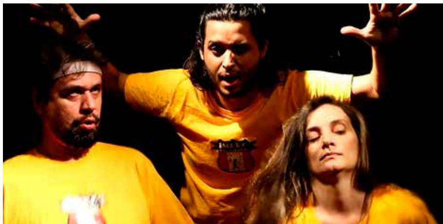
Foto 17 – A Armazena se prepara para entrar em jogo no XIII Campeonato Carioca de Improvisação, no dia 7 de outubro de 2017

candomblé e no carnaval carioca algumas de suas principais referências (MUNIZ, 2015). De fato, a constituição das propostas de improvisação acionadas pelo grupo contou com o mesmo impulso extasiante do delírio que marca a folia carnavalesca e as religiões afro-brasileiras. Em seu debuxo, o Teatro Livre pressupõe um caráter ritualístico capaz de reunir atores e público – ritual este que se encontra visceralmente ligado às ideias de festa e jogo, ajujando-se à necessidade de entender o mundo do avesso, enleando-se à imoderação, ao descomedimento performativo e à expressão sem objurgação dos instintos e das vontades dos brincantes. Candomblé e carnaval são manifestações igualmente importantes para se compreender a encruzilhada de corporalidades na cultura brasileira (CORREIA, 2013).