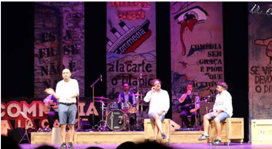
Foto 6 – Diante de aproximadamente 900 espectadores 30 , o grupo Commedia a la Carte estreia “O Pior Espetáculo do Mundo”, na noite de 5 de setembro de 2018, no teatro Tivoli BBVA, em Lisboa

fomentar a criatividade e de estabelecer interações com a audiência. Em paralelo, Drinko (2003) sugere que melhorar o desempenho atoral por meio de exercícios de impro pode ser importante tanto para atores orientados para a improvisação como espetáculo, quanto para aqueles interessados em improvisar apenas como recurso preparatório ou de formação. O autor defende que as técnicas de trabalho das quais se valem os improvisadores podem afetar a consciência e a cognição do ator, expandir seu autoconhecimento psicofísico e proporcionar impressões valiosas acerca de como engajar-se em processos criativos relacionados à produção artística ao vivo.