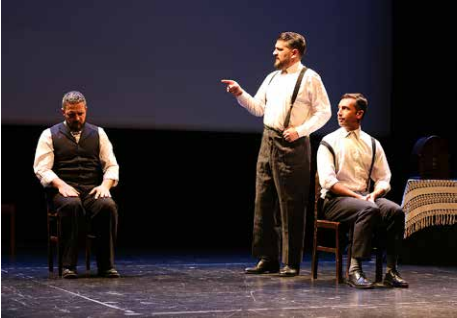
Foto 21 – Os Instantâneos improvisam seu espetáculo “Evaristo” no Centro Cultural Olga Cadaval, em Sintra, na noite de 7 de dezembro de 2018

em palco um clima de severidade para estabelecer a plataforma 41 de uma história improvisada em uma das apresentações de seu espetáculo.