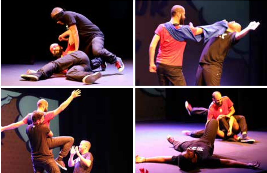
Sequência 5 – O grupo Improv FX performa cenas de lutas na estreia do espetáculo “COMIX”, na noite de 12 de outubro de 2018