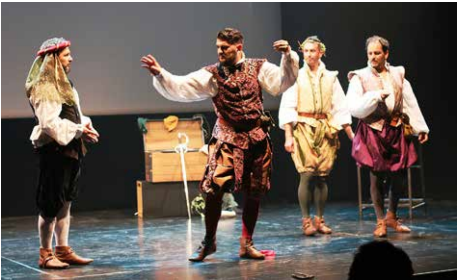
Foto 14 – Inspirados pelo teatro elisabetano, os Instantâneos improvisam uma história insuflada pela herança dramática legada pelo Bardo de Stratford-upon-Avon, em apresentação de Ser ou Não Ser Shakespeare , no Centro Cultural Olga Cadaval, em setembro de 2018

que se desenrolam durante a construção de dramaturgia espontânea. Um ator que se deixa levar de um momento a outro está constantemente fazendo descobertas, o que constitui um estado criador ideal para um improvisador (HALPERN, CLOSE & JOHNSON, 2001). Por outro lado, se um ator procura antecipar-se aos acontecimentos vindouros, ou então se põe recorrentemente a pensar na direção que ele deseja para a cena, ele não será hábil para dirigir sua atenção para o que está acontecendo no momento, e aquilo que acontece no momento é exatamente a cena. Muniz (2015) acrescenta que o teatro de improvisado é a arte do instante por excelência, sendo capaz de refletir a realidade comum a atores e público no momento mesmo em que ambos se encontram em uma experiência compartilhada. Na efemeridade do instante, portanto, o corpo do improvisador deve se transformar diante do público, em aceitação às propostas que lhe são dirigidas, de preferência, com o acabamento técnico capaz de imprimir ao gesto e ao movimento, por exemplo, a qualidade capaz de potenciar a dramaturgia espontaneamente concebida, como demonstra a Foto 14.