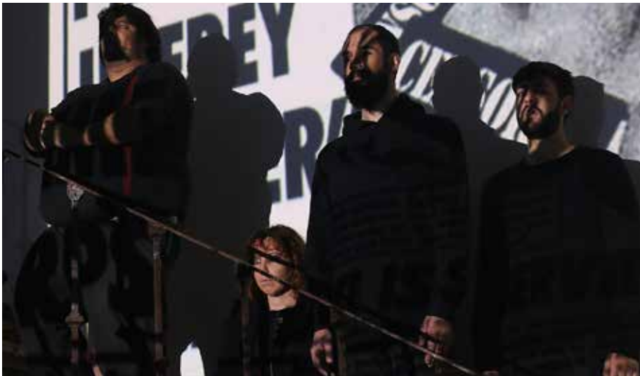
Foto 22 – O espetáculo “A Origem do Medo”, apresentado pelo grupo Sem Rede na noite de Halloween de 2018, na Quinta da Ribafria, em Sintra, depende fortemente da ativação do efeito de presença cênica pelos improvisadores

No contexto de re formação que caracterizou os anos 1990, coletivos de criação como o Teatro Meridional e a Associação Teatral Olho, além de artistas como a diretora Lúcia Sigalho, dentre outros tantos nomes marcantes, são destacados por Vicente (2014c) como representantes inequívocos da pulsação criativa que vigorou nos anos 1990 em Portugal, por terem sido capazes de mobilizar tanto o público quanto a crítica, no que se refere à emersão de novos campos de fruição e de análise. O autor encontra na atriz e encenadora Lúcia Sigalho, por exemplo, uma referência importante para o trabalho corporal como meio primordial da performatividade; nos processos de criação coletiva do grupo Olho, Vicente ( op. cit. , p. 64) percebe “um certo cultivo pelo risco físico por parte dos atores, e pela dimensão mais orgânica dos corpos”; e no repertório do Teatro Meridional, o autor divisa o protagonismo do ator, a partir de uma releitura da tradição da Commedia dell’Arte , por meio da qual são alcançadas formas inovadoras de eloquência física, as quais elevam a novos patamares o trabalho do ator com seu corpo.