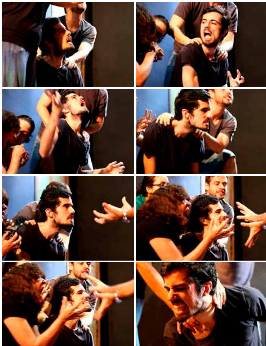
Sequência 1 – Intensificação corporal no processo de criação do espetáculo "O Monstro", pelo Coletivo Improvisadores Anônimos