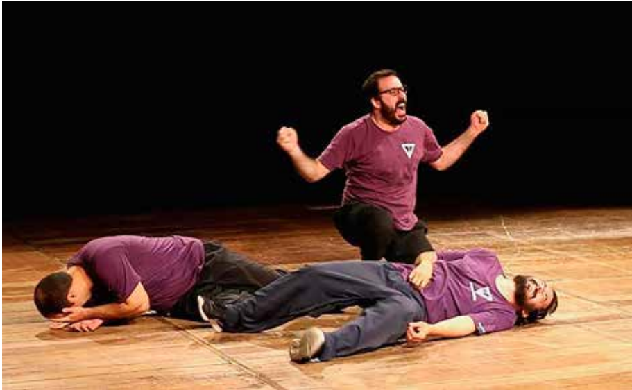
Foto 38 – Os Imprudentes ensaiam seu espetáculo “Impropose” no Teatro Ziembinski, no Rio de Janeiro, em 25 de julho de 2017

O resultado desse movimento de superação salta à vista, como prova o excerto que aparece nas próximas linhas, retirado do diário de campo mantido pelo autor deste relatório, a respeito de um ensaio do espetáculo “Impropose”, para o qual o pesquisador havia sido convidado pelos Imprudentes. A Foto 38 reforça a posição do autor.