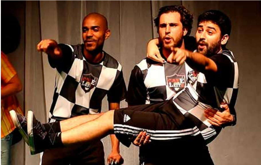
Foto 50 – O grupo Café com Leite canta seu hino durante partida do XIII Campeonato Carioca de Improvisação, em 19 de agosto de 2017

Então, às vezes, a gente não faz gol. A gente não ganha a partida, às vezes. Muitas vezes, perde a partida, mas rolaram uns dribles, rolou alguma coisa... então foi um bom jogo. [Omura_Baby Pedra_BRA]