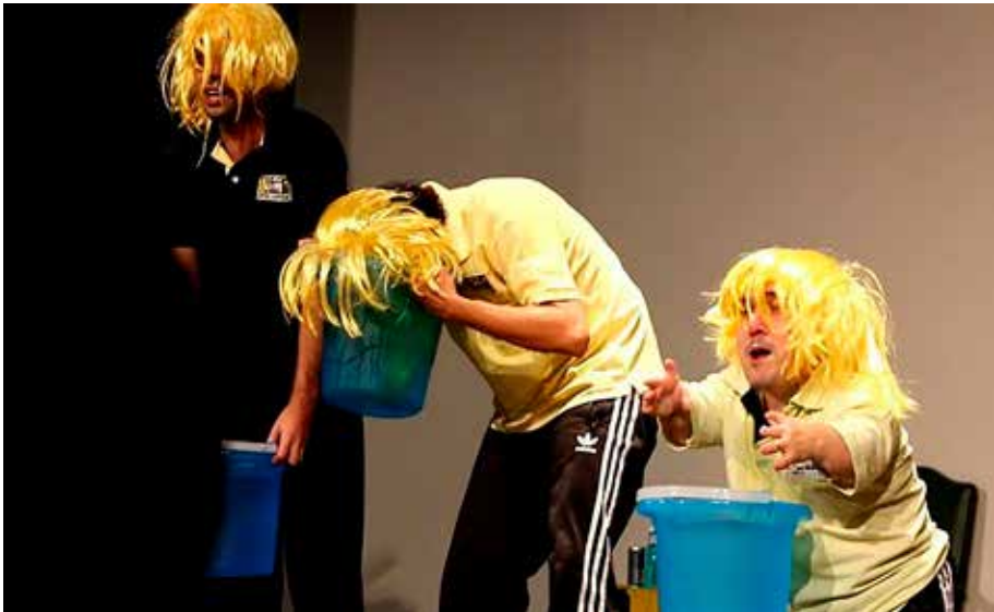
Foto 5 – O coletivo Cachorrada Impro Clube improvisa o quadro “Histórias do Aquaman”, durante o espetáculo “Noite Cachorra”, apresentado na noite de 8 de novembro de 2017, no Festival Universitário de Teatro de Improviso

Nos termos de Fischer-Lichte (2008), o legado teórico de Max Herrmann “rejeita a relação sujeito-objeto na qual os espectadores transformam os atores em objetos de sua observação, enquanto os atores (como sujeitos) deixam de confrontar a audiência (como objetos) com mensagens não-negociáveis”. Ao contrário, a presença física de atores e audientes estabelece uma relação entre co-sujeitos, em que a corporalidade dos espectadores enseja percepções e respostas por meio das quais o público participa do jogo, permitindo que cada espectador atue como um dos co-atores capazes de criar a performance. Associadamente, Herrmann ( id. ) transcende a compreensão do corpo no palco como um mero objeto portador de significados, trazendo para o primeiro plano da encenação a materialidade dos corpos e do espaço, instrumentos primordiais para colocar em ação a performance. De maneira sintética, conforme evidencia Phelan (2003), é pela presença dos corpos físicos que a performance convoca o real. Em tal contexto, segundo Borba (2014, p. 450), “a performatividade é o que possibilita, potencializa e limita a performance”: assim, a performatividade não é um jogo livre, nem uma auto-apresentação teatral, nem tampouco pode ser igualada à performance.