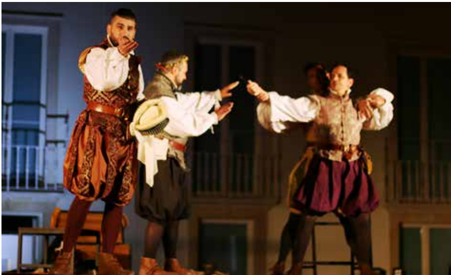
Foto 47 – Valendo-se de sua experiência como animadores, os Instantâneos dirigem-se ao público do Museu Portugal Romano em Sicó (PO.RO.S), na cidade de Condeixa-a-Nova, durante a apresentação do espetáculo “Ser ou Não Ser Shakespeare”, em comemoração ao Dia Internacional dos Museus, na noite de 18 de maio de 2019

comparação com os artistas brasileiros, os improvisadores europeus em geral e portugueses em particular parecem mais dispostos a estabelecer pontos de contato com o público ao longo de seus espetáculos, inclusive convidando espectadores a adentrar o espaço da performance. No caso de Portugal, país no qual a coparticipação do público atinge um grau bastante elevado, talvez essa característica possa ser atribuída precisamente à atividade da animação, que proporciona aos improvisadores portugueses, além de uma performatividade corporal orientada pelo outro, também uma notável comunicabilidade, responsável pela constatação de que, desde os primeiros momentos de um espetáculo improvisado, o diálogo estabelecido com a plateia adquire uma pronunciada organicidade performática em termos de coprodução criativa, tal como ocorre com os Instantâneos, mostrados na Foto 47.