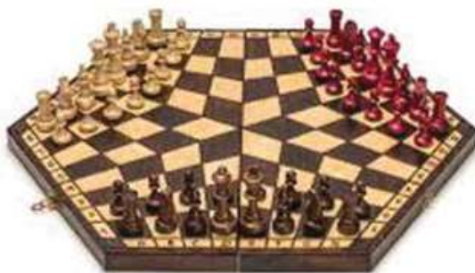
Figura 3: O tabuleiro tripartido para um jogo equânime dos domínios teleológicos

Este exemplo exige algumas condicionantes, que nos parecem frutuosas se transpostas para o outro lado da metáfora. No tabuleiro tripartido, se se quiser introduzir qualquer priorização haverá que, igualmente, justificá-la, assim como qualquer privilégio quanto ao número de jogadas seguidas por um mesmo domínio. Haveria ainda que distribuir as saídas, mas nada obsta a que se redistribuíssem de outro modo noutra ocasião.