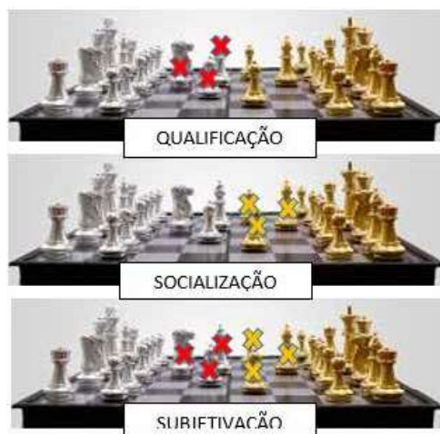
Figura 2: Os tabuleiros pressupostos dos diferentes “jogos de Finalidade Educacional”

Daí que, se queremos desenvolver os três “jogos teleológicos” em igualdade de circunstâncias, melhor se ajustaria o modelo do tabuleiro triplo (VD. Figura 3).