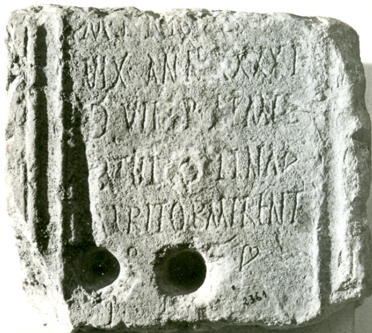
Figura 2. Grinalda da epígrafe da fig. 1