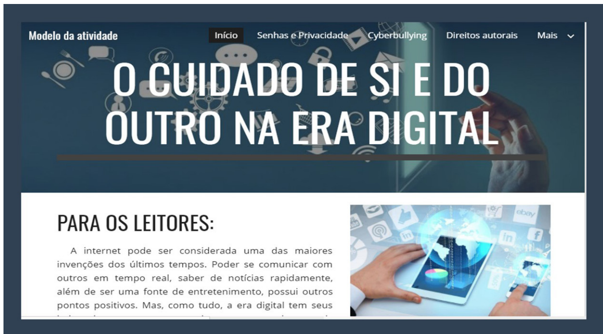
FIGURA 2 - Elaboração do website

tais ferramentas podem contribuir para uma sociedade melhor. Para exporem seus pontos de vista e suas pesquisas, os estudantes criaram vlogs , pequenos parágrafos e imagens, por meio de recursos de edição, para postarem nas páginas dos websites das turmas. Acredita-se que a criação dos websites de divulgação na internet não só contribui para a aprendizagem dos estudantes, mas também alerta toda a comunidade.