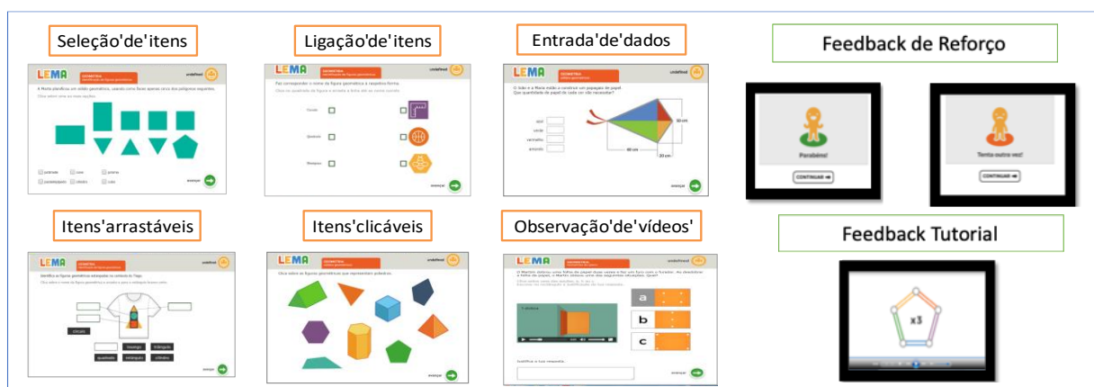
Figura 1 – Elementos incorporados nas atividades do LEMA Fonte: SANTOS (2018)

O LEMA incorpora 32 atividades baseadas num conjunto de funções que permitem a manipulação direta de itens visuais (cf. Figura 1). Para além da ilustração simples e cuidadosa dos layouts de cada atividade, foram também incorporados feedbacks de reforço automáticos com animações visuais e sonoras e, em algumas atividades, incorporaram-se feedbacks tutoriais. Os feedbacks são estratégias-chave para crianças com PEA para melhorar a sua precisão matemática de resolução de problemas, a explicação dos conceitos matemáticos e completar problemas mais complexos de forma autónoma (DELMOLINO et al., 2013).