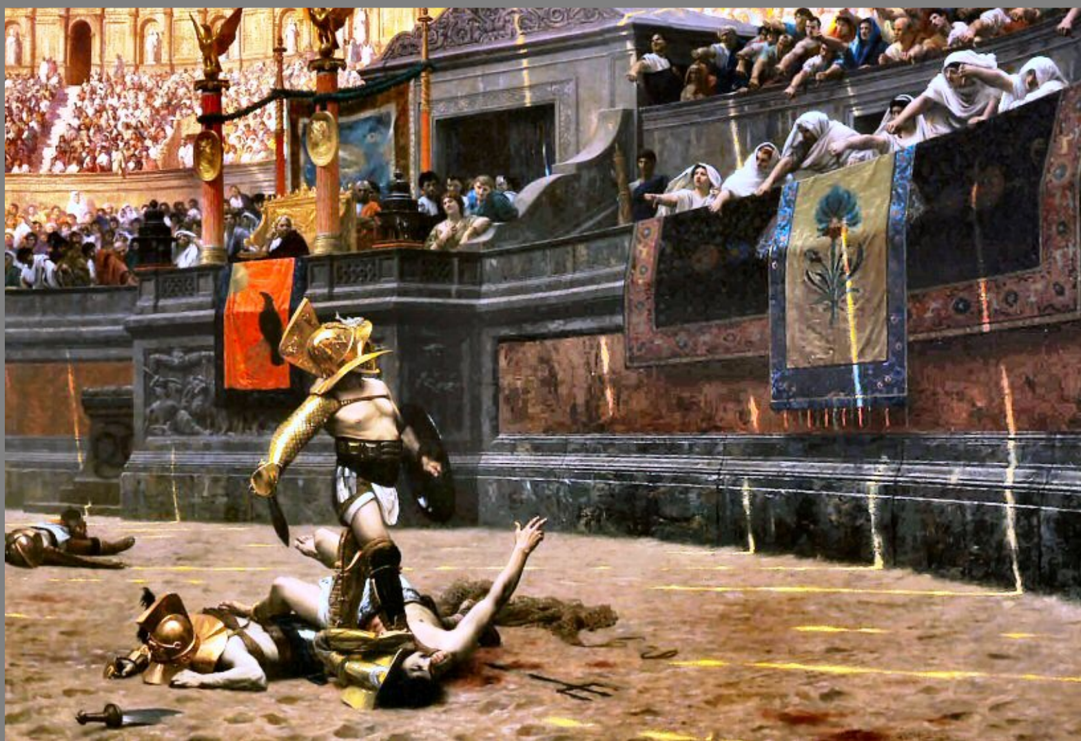
Pollice verso (1872). Jean-Léon Gérôme. Phoenix Art Museum.