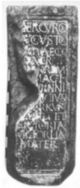
Figura 3. Epígrafe votiva romana patente nas termas de S. Pedro do Sul.

Outro modo de a mulher se manifestar é mediante a apresentação de dedicatórias a divindades. Tratava-se, aparentemente, de um acto individual, de devoção; o certo é que, assim, mais famílias estão a marcar presença.