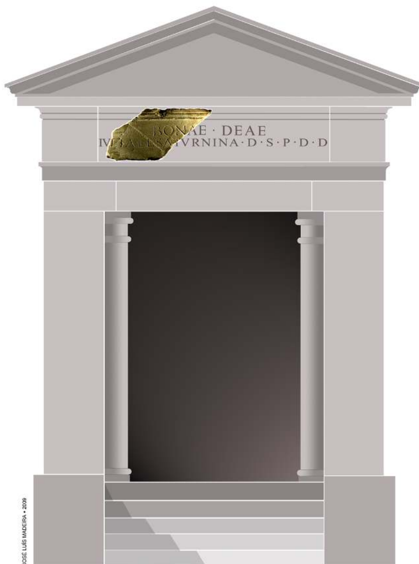
Figura 4. Proposta, de José Luís Madeira, de templete para a inscrição dedicada à Bona Dea, em Beja.