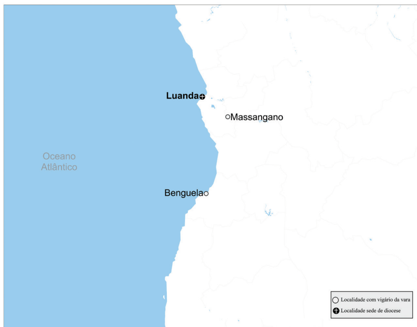
Mapa 3 – Vigararias da vara na diocese de Angola em 1690.

A comprida diocese de Olinda, criada em 1676, forçou os bispos a reformularem a rede da sua justiça periférica, como já bem explicado 102 . Em 1701, além do vigário-geral e provisor residente em Olinda, havia dois vigários-gerais, um em Ceará Grande (atual Fortaleza) e outro em Penedo. Existia ainda um conjunto de vigários da vara vinculados a cada uma destas três vigararias-gerais, que a fonte utilizada, todavia, não inventaria 103 . Em 1749, no entanto, a rede densificou-se. Dispunha de mais um vigário-geral em Manga de Paracatu, mantinha-se o de Ceará e, a sul, a vigararia-geral já não se situava em Penedo mas em Alagoas do Sul (atual Marechal Deodoro). Num patamar inferior e em articulação com estas vigararias-gerais, atuavam dez vigários da vara, em Acaraú, Alagoa de São Miguel (hoje São Miguel