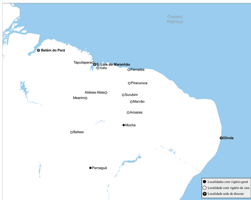
Mapa 5 – Vigários-gerais e vigararias da vara na diocese do Maranhão em 1769.

nos lugares do sertão, devido à grande extensão deles e por causa do crescente aumento de dia para dia dos que os habitam” 105 . Por 1750, Mocha passou a vigararia-geral e, em 1769, foi criada a vigararia-geral de Parnaguá 106 . A provisão do vigário-geral desta última seguiu o modelo da vigararia-geral de Sergipe del Rei, ficando com jurisdição na parte sul do bispado.