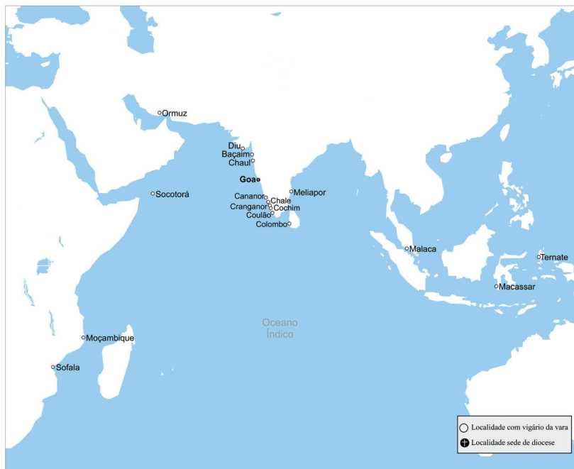
Mapa 1 – Vigararias da vara na diocese de Goa em meados do século XVI.

Ela abarcava a África oriental e a Ásia, até Malaca, existindo vigários em 17 fortalezas: Baçaim, Chaul, Cananor, Chale, Cochim, Colombo, Coulaõ, Cranganor, Diu, Malaca, Macassar, Meliapor, Moçambique, Ormuz, Sofala, Socotorá e Ternate. De cinco (Baçaim, Chale, Macassar, Meliapor e Socotorá), só sobreviveram registos documentais a partir da década de 40 do século XVI, admitindo-se que só foram criadas e dotadas de vigário durante o episcopado de D. frei Juan de Albuquerque (1538-1553). As outras existiam desde o tempo em que estas zonas pertenciam à diocese do Funchal. Nos anos 30 do século XVIII, porém, já só havia oito vigários da vara no arcebispado: um em Chaul, Baçaim, Tana, Damão e Diu e três no reino de Canará, região a Sul de Goa 99 .