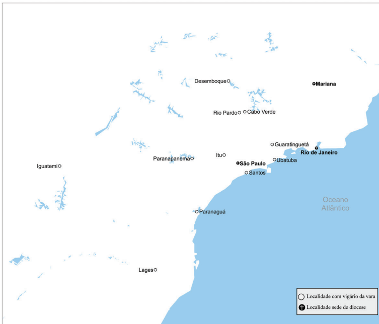
Mapa 6 – Vigararias da vara na diocese na diocese de São Paulo em 1769.

clérigos de seu distrito, e legoas que compreende cada huma das freguesias, e as necessidades espirituais que ha, com meyo por que se podem suprir e remediar 107 . Depois, utilizou os relatos recebidos para redesenhar os territórios sob jurisdição dos vigários da vara, considerando as distâncias e os contingentes populacionais 108 . A diocese ficou com seis vigararias da vara: Guaratinguetá, Itu, Paranapanema, Paranaguá, Santos e Ubatuba, enquanto disputava com Mariana Santana do Sapucaí 109 . Em 1769, o cabido, sede vacante, criou vigários forâneos em Cabo Verde, Desemboque, Iguatemi, Lages e Rio Pardo, subordinando-os ao vigário da vara de Paranaguá, o qual tinha competências mais amplas 110 .