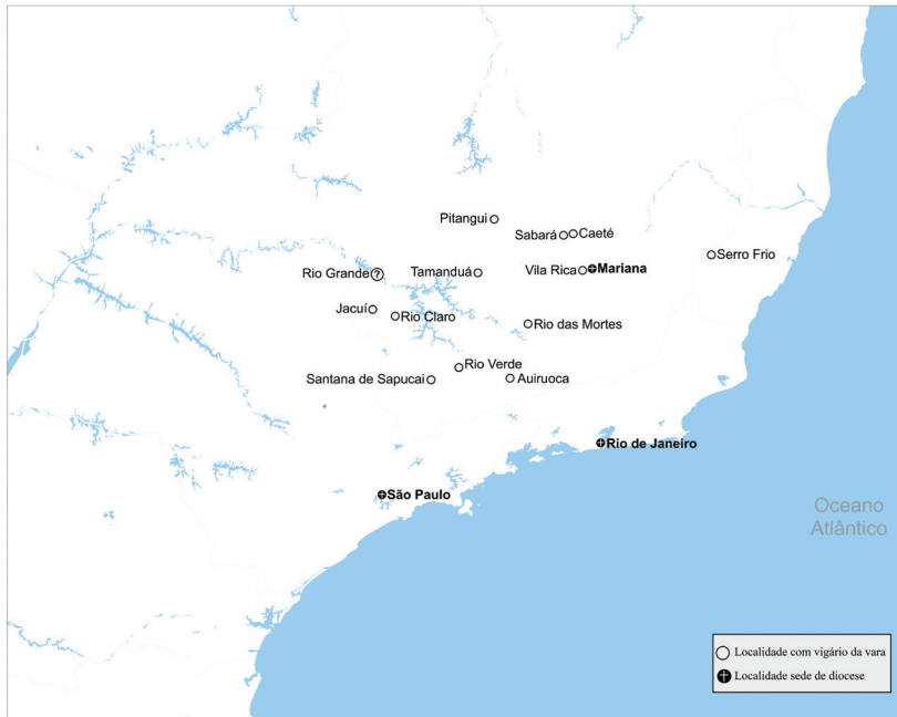
Mapa 8 – Vigararias da vara na diocese de Mariana em 1750-1765.

Serro Frio e Vila Rica. As restantes sete eram Aiuroca, Caeté, Jacuí, Rio Claro, Santana de Sapucaí, Tamanduá e o Rio Grande 112 .