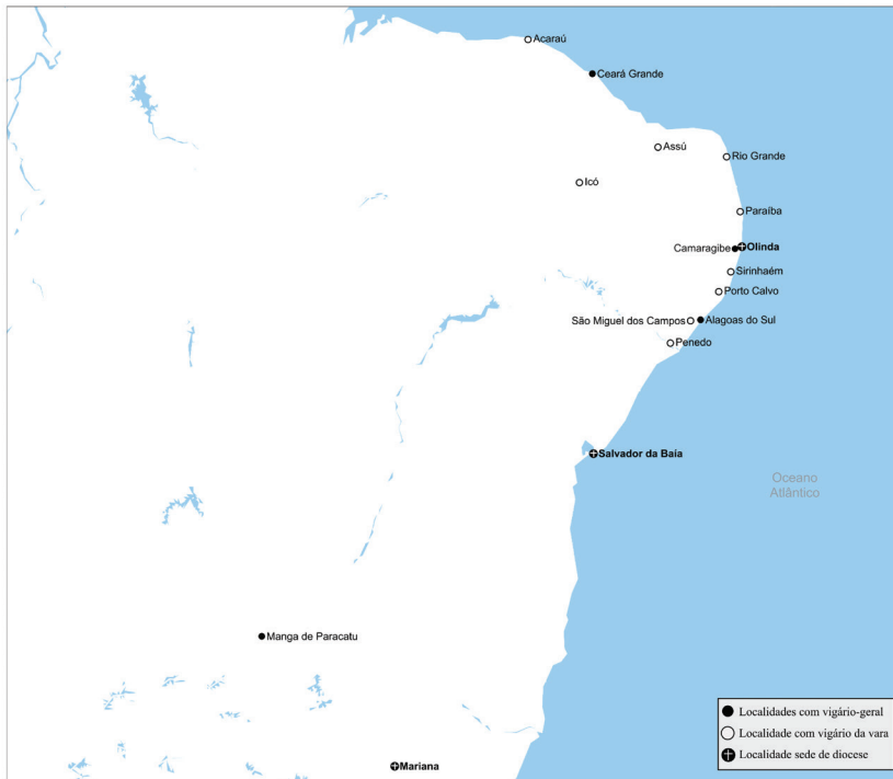
Mapa 4 – Vigários-gerais e vigararias da vara na diocese de Olinda em 1749.

dos Campos), Assú, Camaragibe, Icó, Paraíba (hoje João Pessoa), Penedo, Porto Calvo, Sirinhaém e Rio Grande (atualmente Natal).