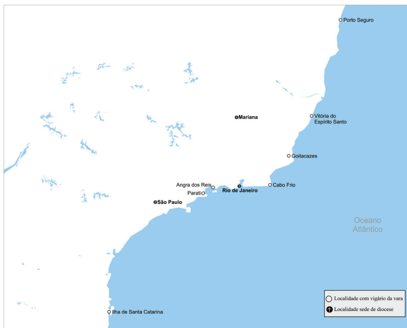
Mapa 7 – Vigararias da vara na diocese do Rio de Janeiro em 1752.

No Rio de Janeiro, o bispo, escrevendo para Roma, em 1752, quando a diocese já fora amputada de áreas que passaram a integrar os bispados de Mariana e de São Paulo, referia existirem vigários da vara ou forâneos em Angra dos Reis, Cabo Frio, Goitacazes, Ilha de Santa Catarina, Parati, Porto Seguro e Vitória do Espírito Santo 111 .