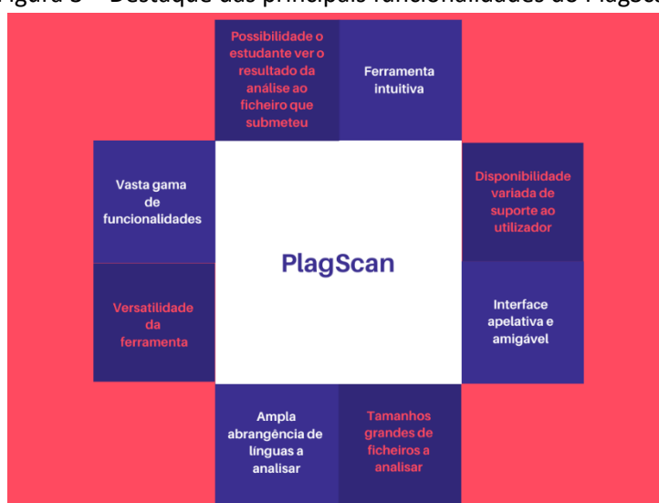
Figura 3 – Destaque das principais funcionalidades do PlagScan

Primeiramente, o PlagScan é uma ferramenta bastante intuitiva, com uma interface apelativa e amigável, tendo ao seu dispor uma vasta gama de funcionalidades que a fazem destacar em relação a outras ferramentas de deteção de plágio. De seguida, iremos sintetizar algumas das suas principais funcionalidades, destacadas na Figura 3.