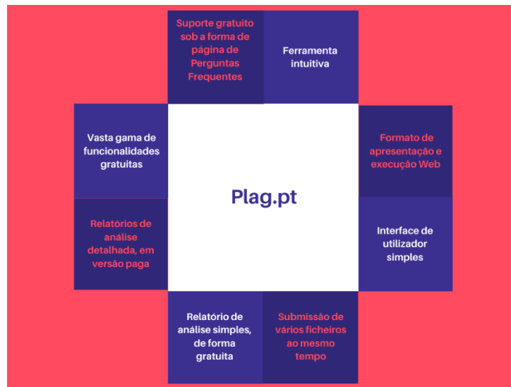
Figura 5 – Destaque das principais funcionalidades do Plag.pt