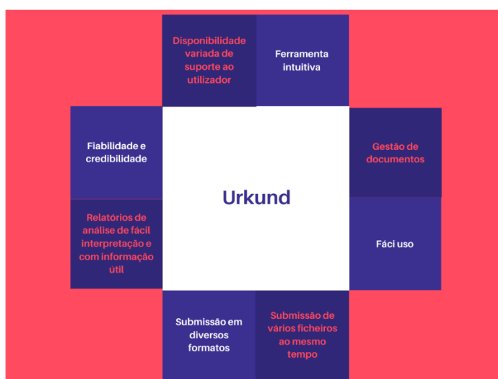
Figura 4 – Destaque das principais funcionalidades do Urkund

Por seu lado, o Urkund tem a seu favor o facto de ser intuitiva e de fácil uso, além de outras vantagens, elencadas na Figura 4, e que iremos explicitar de seguida. Apesar de ser paga, é utilizada por instituições de ensino, o que comprova a sua fiabilidade e credibilidade. Desta forma, permite que os docentes possam ter o trabalho facilitado na deteção de plágio nos trabalhos dos seus alunos. No entanto, pode igualmente ser utilizada em ambientes de negócio.