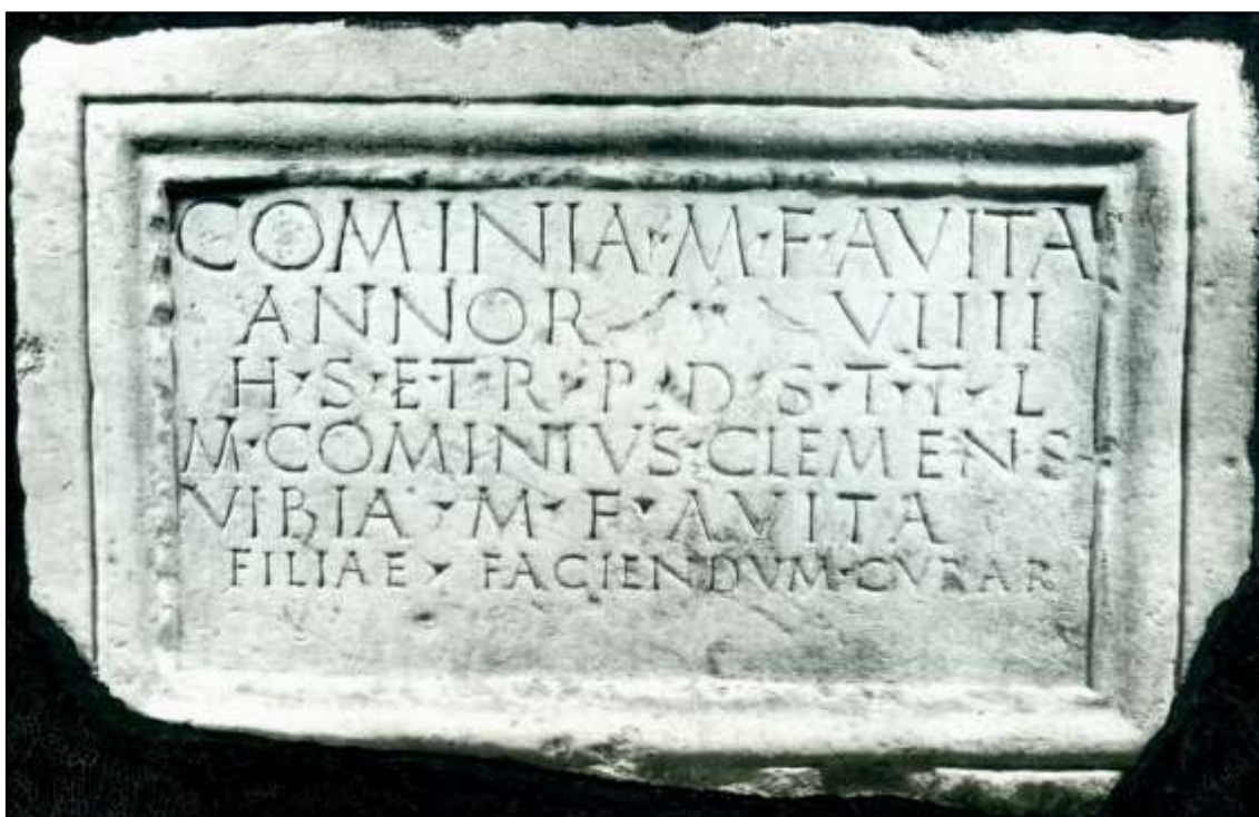
Figura 3. O epitáfio de Cominia Avita , de Elvas.

Sirva-nos de testemunho a placa com o epitáfio de Cominia Avita , de nove anos, mandado, naturalmente, gravar por seus pais (IRCP 583 – fig.3). Atente-se na ternura familiar – 9 aninhos!... Nas duas pombas afrontadas – inocência! No voto te rogo praeteriens dic sit tibi terra levis , de que se conhecem outros exemplos na Bética mas mui escassos na Lusitânia. Na transmissão perfeita dos nomes: a menina tem o gentílico do pai (como é de lei) e o cognomen da mãe (tradição que nem sempre é respeitada). No uso de curarunt por curaverunt , a denotar cabal conhecimento das regras ortográficas.