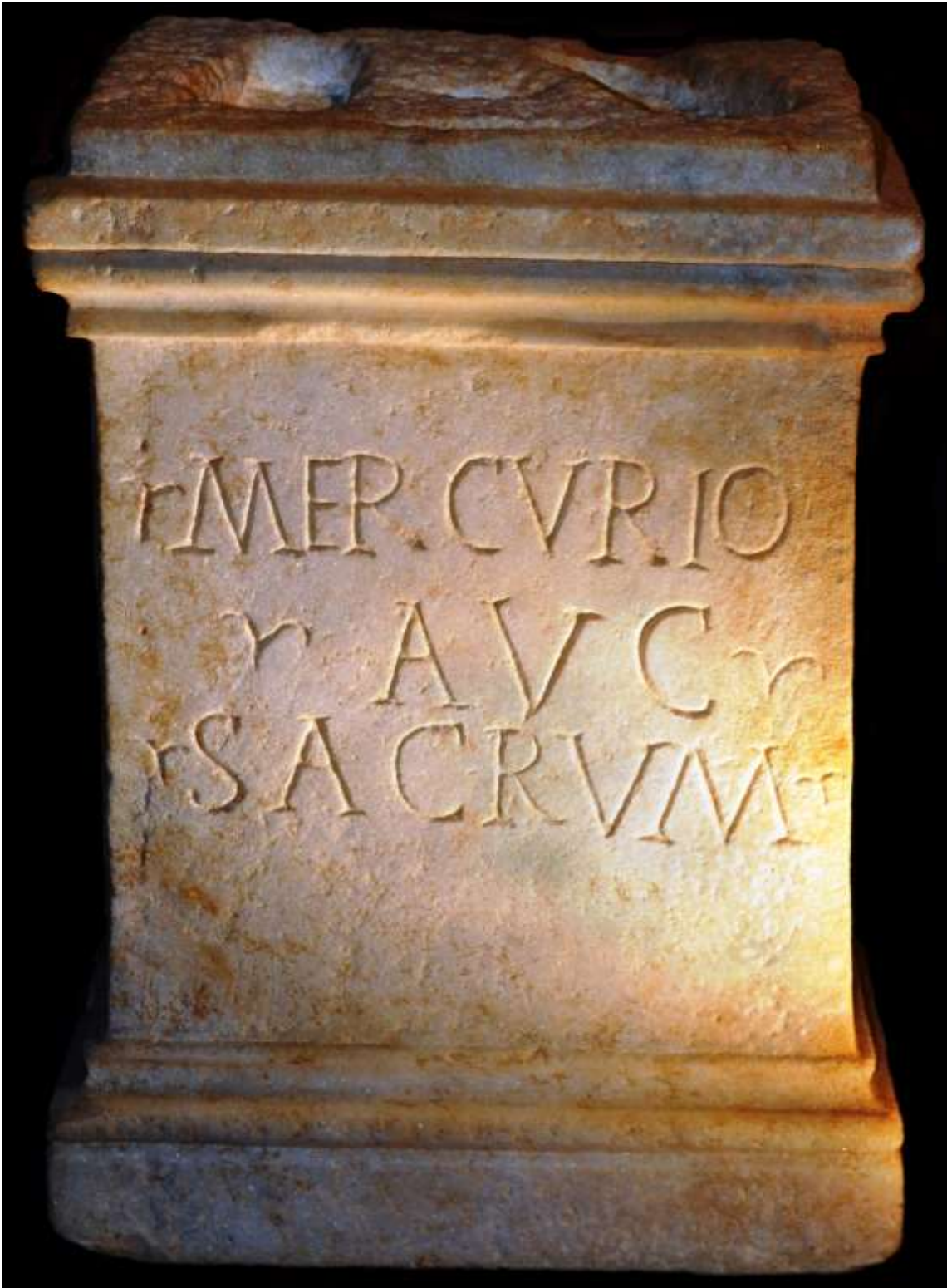
Figura 2. O altar a Mercúrio Augusto, de Ammaia .

– a estela funerária magnífica, de um cidadão romano, inscrito na tribo Quirina (que foi a adscrita à civitas após a elevação a município), Gaius Sentius Capito (Mantas, 2004: 92-97). Tem a família Sentia testemunhos na capital da província ( Emerita Augusta ) e em Abelterium , como se viu.