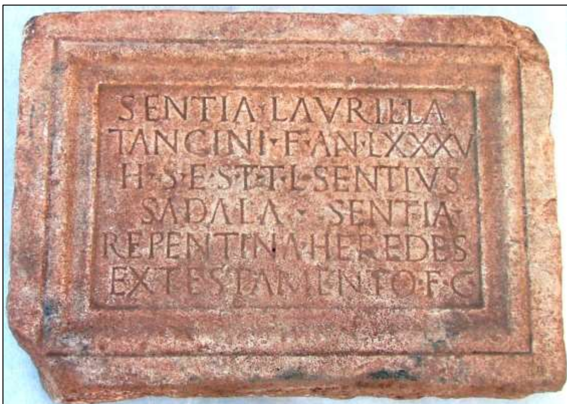
Figura 1. O epitáfio de Sentia Laurilla, de Alter do Chão.

Era como que um registo das fornadas que se iam fazendo. O telheiro era de Castor e Vernáculo fez questão em esclarecer que tudo se passava em Abeltírio , corruptela do topónimo Abelterium , conhecido pelos itinerários e de cuja localização ainda se não tinha a certeza. Esta telha veio, por conseguinte, confirmar a hipótese de o actual nome «Alter» ter sido derivado do latino Abelterium (António e Encarnação, 2009).