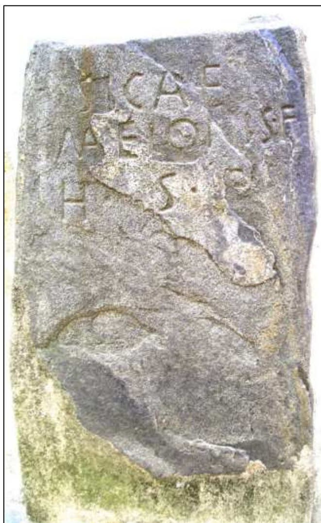
Figura 5. A estela de Sica, de Elvas.

De facto, é possível pôr lado a lado, inclusive porque de mui idêntica tipologia, o ex-voto que Faustus , liberto de Bassus , dedicou a Júpiter (IRCP 607) e o que o indígena Lupus , filho de Lancius , dedicou à divindade local Quangeius Tangus (IRCP 641). E sublinhar a persistência, nos monumentos funerários, da tipologia e da onomástica pré-romana, como os epitáfios de Sica Maelonis filius (em mui singela e tosca estela de xisto: IRCP 631 – fig. 5) e de Camira Maxumi filia (já trabalhada e encimada por rosácea: IRCP 624) permitem observar.