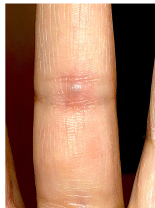
Figura 1 Nódulo violeta azulado en el dedo, a nivel de la articulación interfalángica proximal.

Una mujer de 40 años se presentó con un nódulo doloroso de aparición súbita en el aspecto palmar del tercer dedo izquierdo, en la mano no dominante. El nódulo había aparecido hacía 4 días. No se encontraron traumatismos locales ni fenómeno de Raynaud en sus antecedentes, que tampoco incluían tabaquismo, ingesta de drogas u otras comorbilidades.