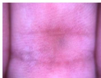
Figura 2 Examen dermatoscópico que muestra un patrón azul sin estructura.

Se observó un nódulo azulado-violáceo de 4 mm en el lado palmar del tercer dedo, al nivel de la articulación interfalángica proximal (IFP) (fig. 1). El nódulo era altamente sensible a la compresión y estaba fijado a las estructuras subcutáneas. No se produjo cambio de color en la punta del dedo y la pulsación de las arterias radial y ulnar izquierdas fue normal. No hubo otros datos destacables en la exploración física.